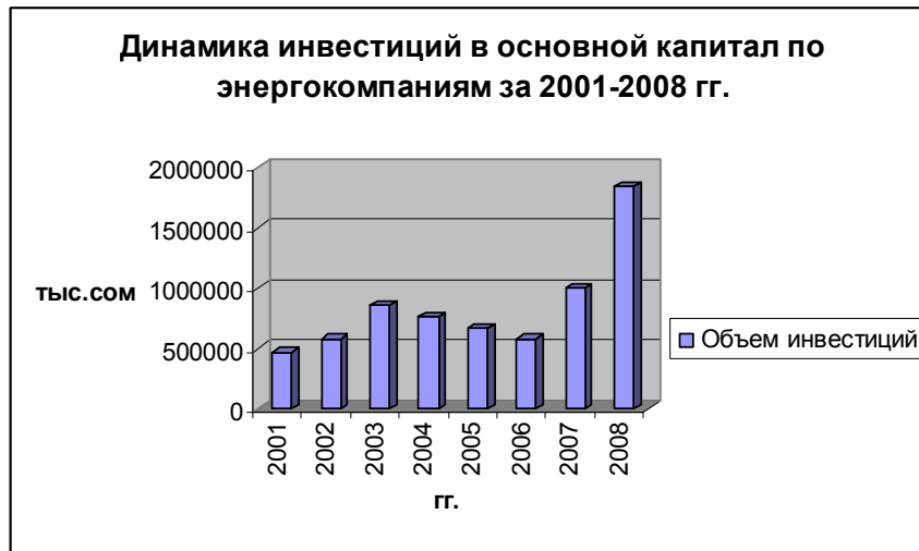
Рис. 1. Динамика инвестиций в основной капитал по энергокомпаниям за 2001-2008 гг.

Анализ инвестиций по источникам финансирования за 2008 год представлен на рис.