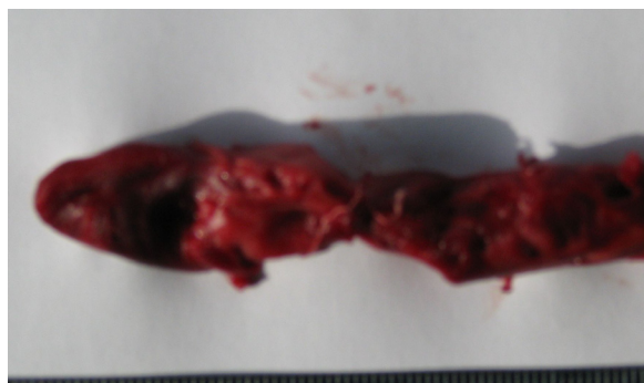
Рис. 5. Удаленный тромб методом эндоваскулярной катетерной тромболитики.

случаях была выполнена лишь пликация нижней полой вены. Из 12 случаев, в которых была выполнена лишь пликация НПВ, в 1 случае наблюдался эмбологенный тромбоз обеих бедренных вен, в 8 случаях илиокавальная форма тромбоза с распространением эмбологенной части в инфраренальный сегмент НПВ, в 3 случаях илиокавальная форма тромбоза с распространением эмбологенной части в интра-и супраренальный сегмент НПВ.