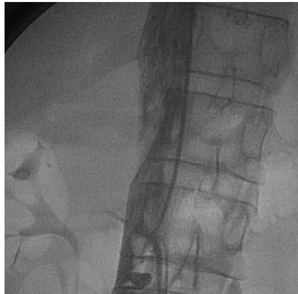
Рис. 2. Рентгеноконтрастная илиокавография. Определяется эмбологенный илиокавальный тромбоз, доходящий до уровня впадения почечных вен.