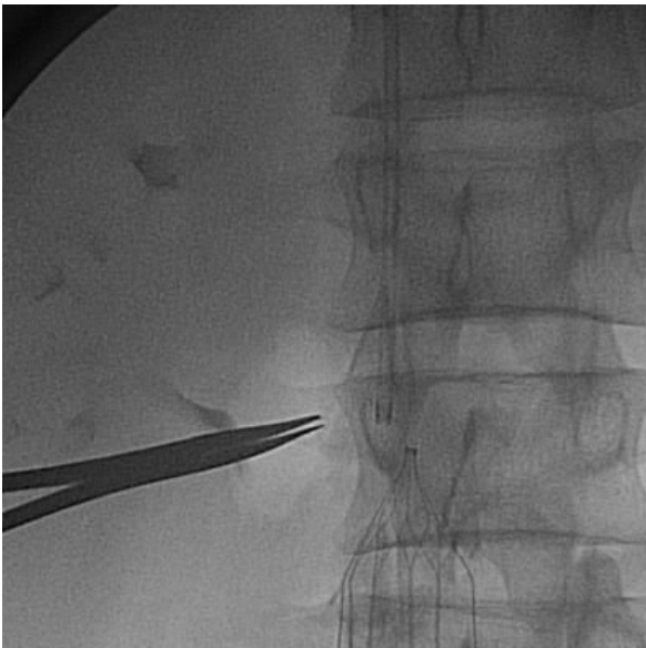
Рис. 1. Ангиоскопия. Имплантированный противэмболический фильтр Cordis в стандартную позицию.

Вмешательства на нижней полой вене были выполнены 24 больным из наблюдавшихся 155 пациентов, которым проводилась хирургическая профилактика ТЭЛА в связи с переходом тромботического процесса на нижнюю полую вену. Всем 24 (100,0%) больным была произведена пликация нижней полой вены тотчас ниже устья почечных вен. В 12 (50%) случаях пликация нижней полой вены дополнялась тромбэктомией эмбологенной части тромба и в 12 (50%)