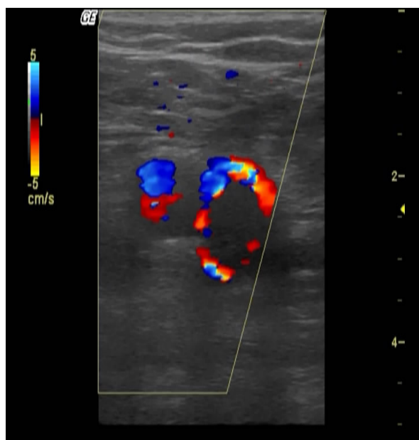
Рис 1. Ультразвуковое дуплексное ангиосканирование. Определяется эмбологенный тромбоз на уровне общей бедренной вены.