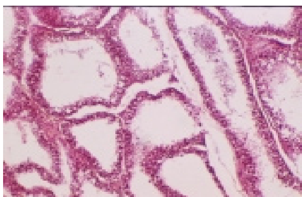
Фото 3. Яичко кролика на 40 день после окончания 15 дневного введения гуморальной фракции. Окраска гематоксилин-эозином. Ув. 40x8.

Во всех семенных канальцах цитоплазма клеток Сертоли значительно вакуолизирована – то есть они в состоянии гидropической дистрофии. В значительной части семенных канальцев отмечается смещение половых клеток в просвет канальцев. В отдельных канальцах в составе сперматогенного эпителия встречаются гигантские многоядерные клетки (в норме таких клеток нет). Базальная мембрана канальцев обычная, выражена на всём протяжении. Гормонопродуцирующие клетки (клетки Лейди́га) немногочисленны и представлены неактивными малыми формами.