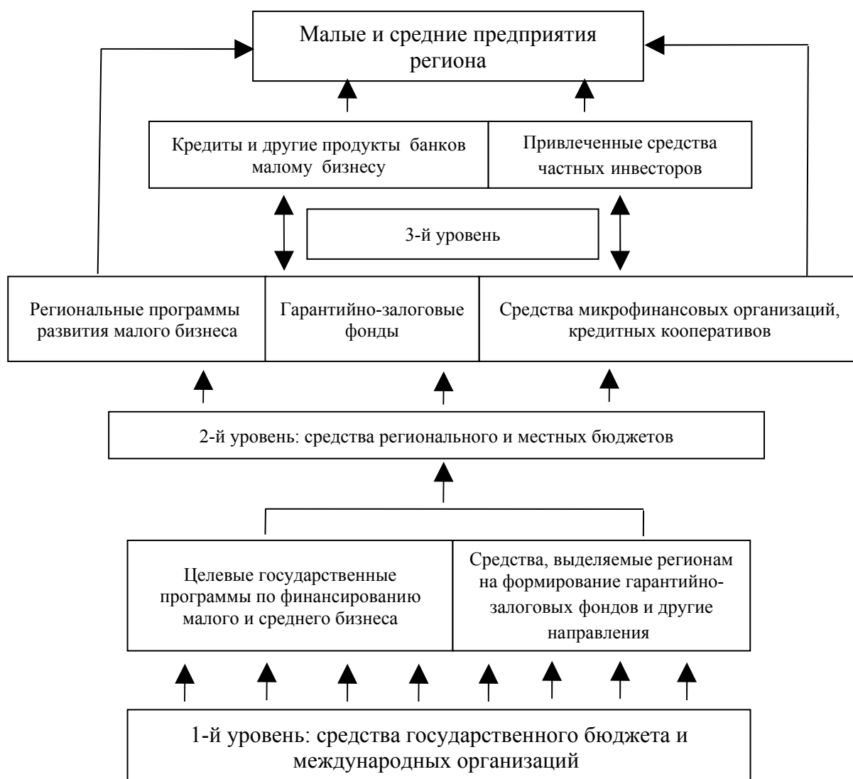
Рис. 3. Модель инфраструктуры финансово-кредитного механизма поддержки малого и среднего бизнеса в КР 6

Приведенные данные убеждают в необходимости поддержки способности малых и средних предприятий к результативному развитию, что требует, на наш взгляд, реализации в полном формате многоуровневого подхода к решению данной проблемы. В практическом плане это означает объединение усилий государственных органов, региональных и местных государственных структур, банковского сектора, частных инвесторов, самих малых и средних предприятий в рамках единого финансово-кредитного механизма (рис. 3).