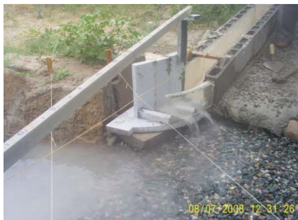
Рис. 1. Модель концевой части ПВС с высокой боковой стенкой – ограничителем.