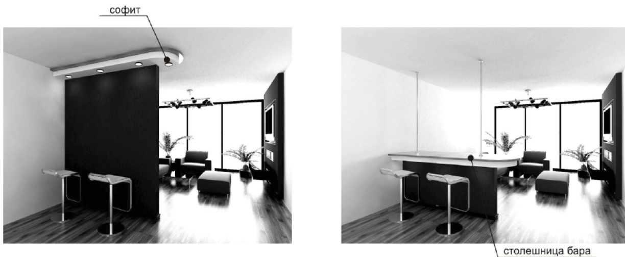
Рис. 4. Общий вид выдвигной перегородки.

терьера. Панели могут задвигаться в специально монтируемые ниши, требующие достаточно большого пространства. Ширина панели зависит от перекрываемого проема и количества створок в системе. Высота панели может достигать 3–3,5 м. Современный механизм трансформации сдвижной перегородки, прошедшей долгий путь развития, выдерживает нагрузку до 200 кг/м направляющей рельсы, что позволяет устанавливать перегородку из любого, даже самого тяжеловесного материала, и передвигать ее легким движением руки.