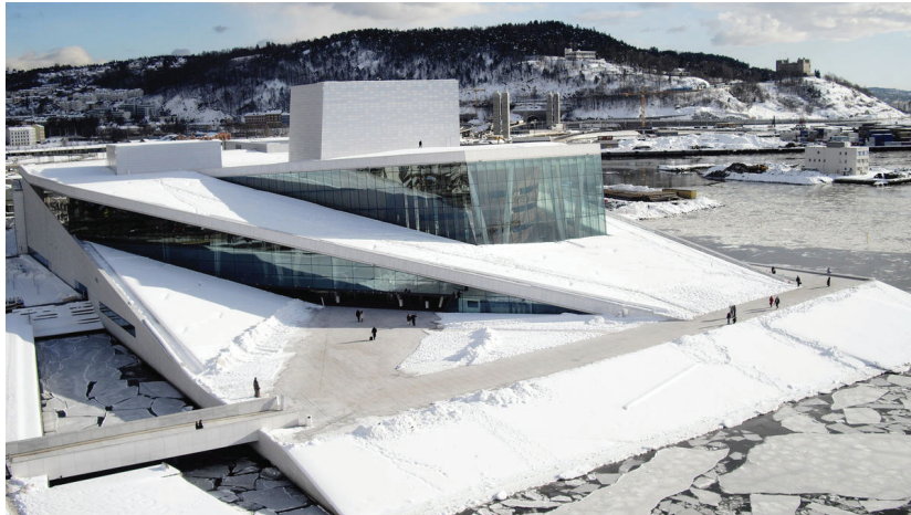
Рисунок 3 – Норвежский национальный театр оперы и балета