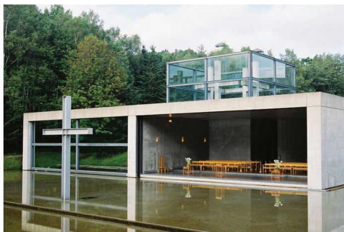
Рисунок 5 – Храм на воде – Тадао Андо