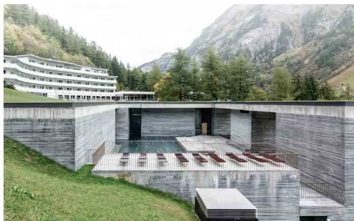
Рисунок 1 – Термы Вальс (Главный вид)

Тадао Андо – «архитектурная тишина» (рисунок 5). В работах Т. Андо свет используется как инструмент медитативного восприятия пространства, что особенно актуально для термальных залов с повышенной влажностью и отражённым рассеянным освещением [6].