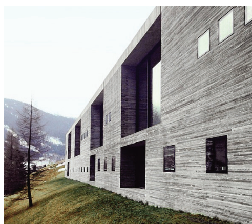
Рисунок 2 – Термы Вальс (Боковой вид)