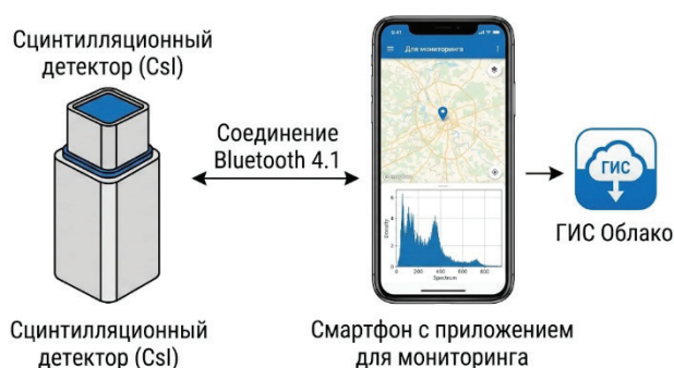
Рисунок 1 – Структурная схема программно-аппаратного комплекса для мобильного радиационного мониторинга

3. Идентификация нуклидов: с помощью встроенных библиотек изотопов и анализа пиков полного поглощения проводилось разделение вклада естественных (K-40, Th-232, Ra-226) и техногенных (Cs-137) радионуклидов.