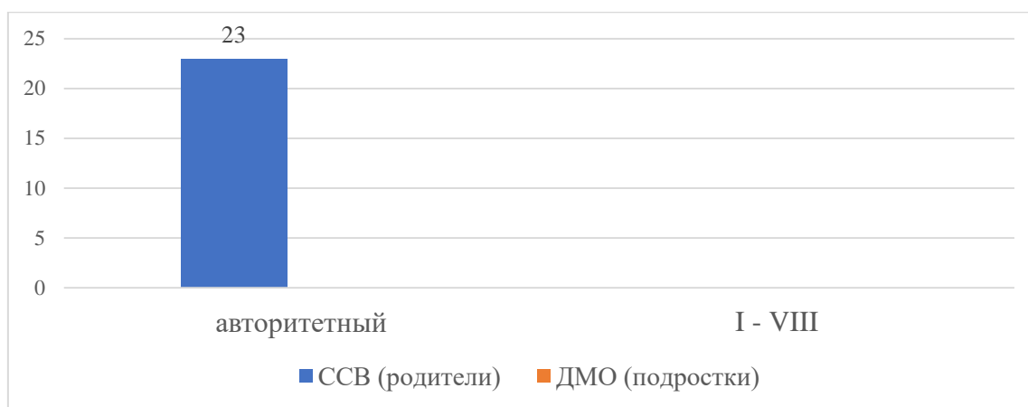
Рис. 1. Высокие показатели по методикам «Стратегии семейного воспитания» С.С.Степанова и «Диагностика межличностных отношений» Т.Лири

капризность, трудности с границами и обязанностями, ощущение ненужности и низкая самооценка. В стратегии поведения в конфликте выбирают сотрудничество, родитель стремится к взаимопониманию и уважению мнения ребенка, что приводит к воспитанию толерантности, доверию и умению решать конфликты. В эмоциональном интеллекте у родителей выявили управление своими эмоциями и распознавание эмоций других людей, умение контролировать эмоции, не подавлять, но выражать экологично, выстраивание здоровых доверительных поддерживающих отношений, ребенок учится спокойствию, устойчивости, безопасности и развивает уверенность в общении.