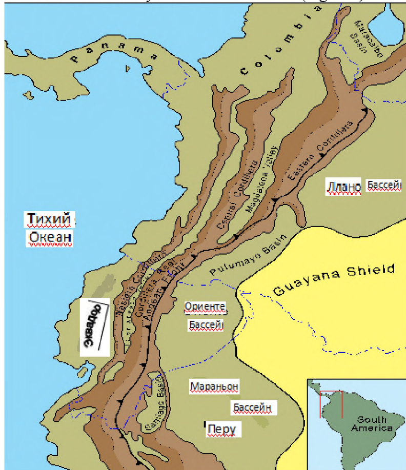
Figure: 1. Layout of the Oriente basin [1,2]

Main part. The Oriente Basin includes that part of the back-arc syncline system located in Ecuador and northeastern Peru between the Vaupes Swell geological basement arcs in the east-west line in southern Colombia and the Contoza arc in northern Peru (Fig. one).