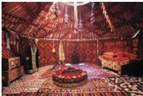
Боз үйдүн жалпы ички көрүнүшү

Боз үйдүн так ортосу-коломто, ага казан асылат. Төр - үйдүн эшикке карама-каршы тушу. Анда жүк жыйылып, ала кийиз, өрө кийиз, шырдак, көлдөлөң, төшөк салынат. Жүктүн эки жагына текче илинет.