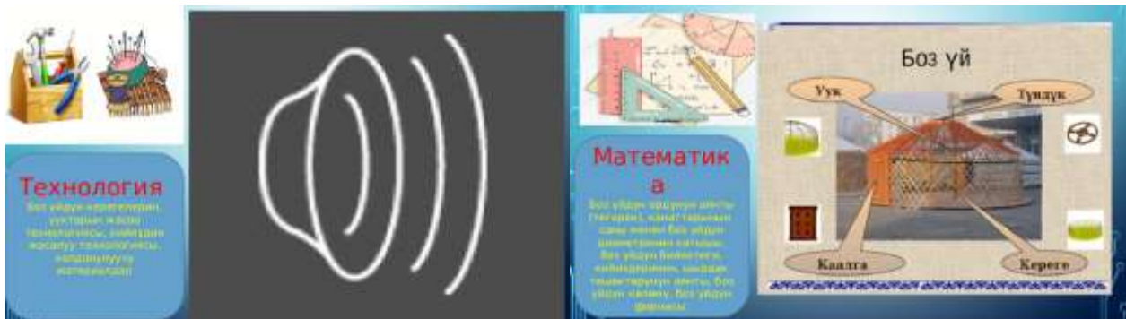
Боз үйдүн математика предмети менен болгон байланышы

Математика: Боз үйдүн геометриялык формасын изилдөө: айлана, конус, жана цилиндр формаларын талдоо. Боз үйдүн көлөмүн, бийиктигин, айланасын жана башка параметрлерин эсептөө. Боз үйдүн бөлүктөрүнүн симметриясын жана пропорцияларын талдоо.