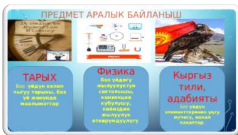
Боз үйдүн предмет аралык байланыштары

Кыргыз тил жана адабияты: Боз үйдүн ар бир элементтеринин аталышы, алардын уңгу, мүчөсү, боз үйдүн философиясы, тарбиялык маанилери, макал-лакаптар ж.б.