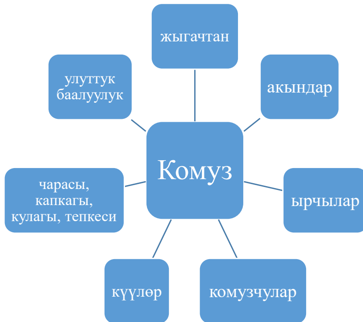
Сүрөт 3. Комуз үчүн класстер