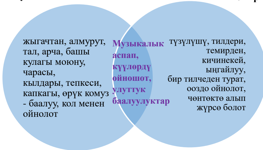
Сүрөт 2. Комуз жана темир ооз комуз үчүн Венндин диаграммасы