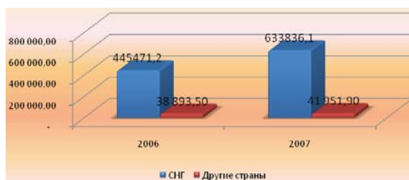
Рис. 1. Денежные переводы физических лиц в КР (тыс. долларов США) по данным НБКР.