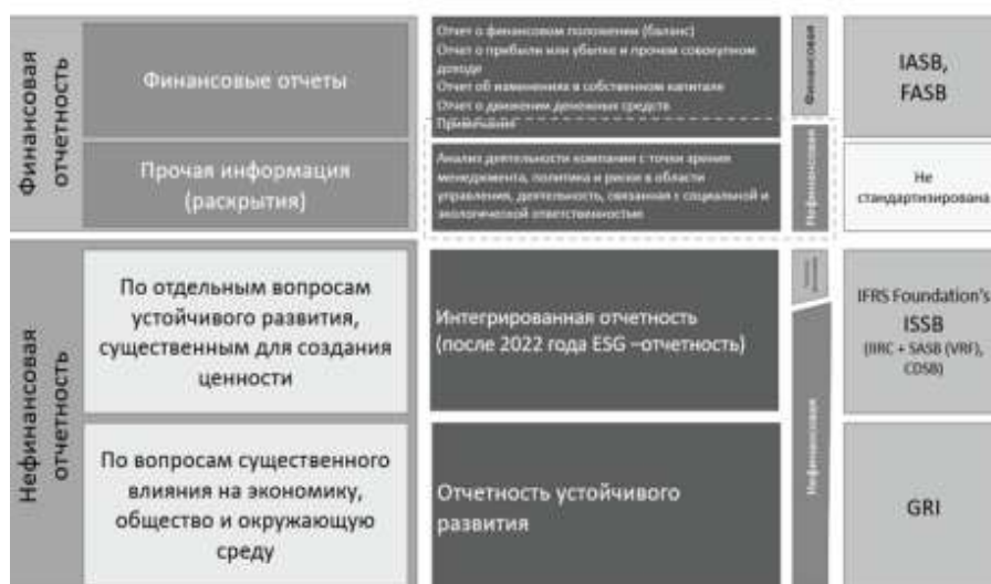
Рисунок 1. Наиболее распространенные виды корпоративной отчетности и их регуляторы

Формирование финансовой отчетности происходит посредством генерирования финансовой информации в системе бухгалтерского учета. Эта информация необходима внутренним и внешним пользователям для принятия обоснованных экономических решений. «Глобальные проблемы, с которыми сталкивается современная цивилизация, а именно: ограниченность ресурсов (земли, воды, полезных ископаемых и т.д.) и возможностей утилизации отходов производства на планете, - главная причина, вызывающая необходимость изменить отношение к функциям бухгалтерской службы и в целом к роли учета и отчетности в системе управления» [8, с.16]. Данные изменения приводят к тому, что возникает необходимость в нефинансовой отчетности, которая будет раскрывать информацию в области устойчивого развития и влияния компании на экономику, общество и окружающую среду (рис.1).