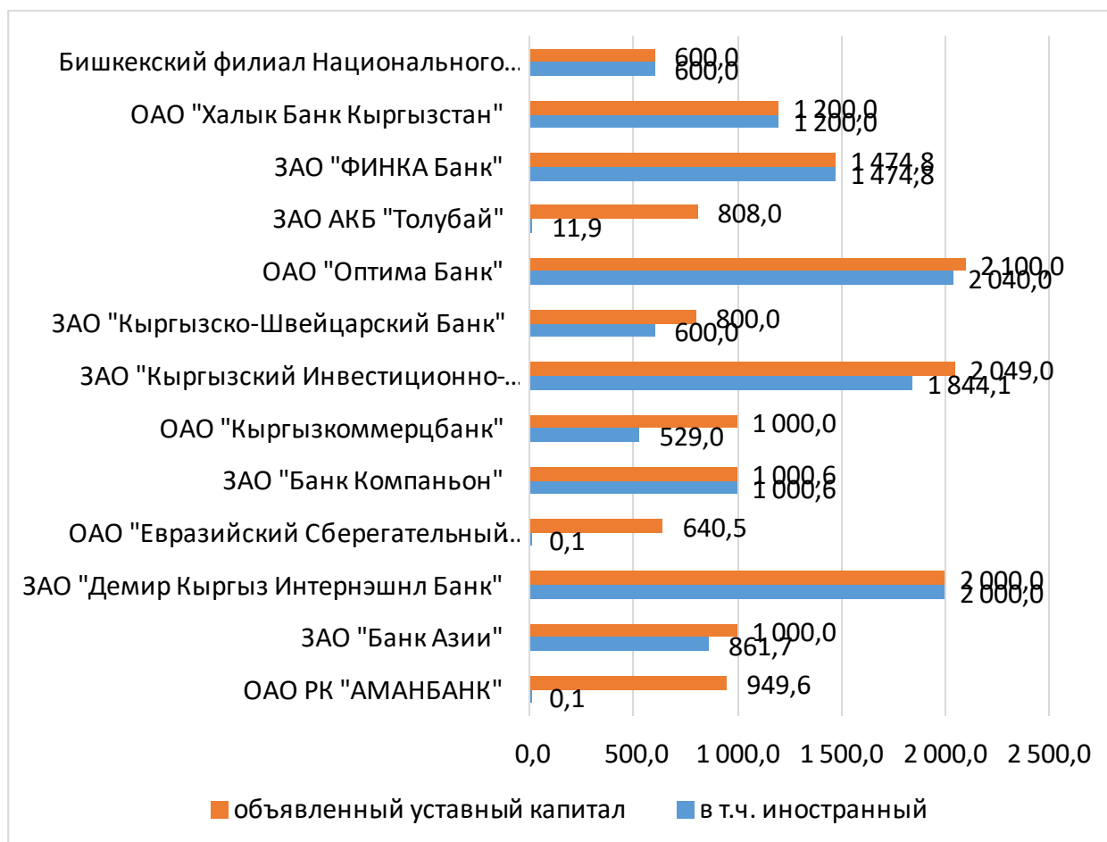
Рисунок 1. Уставный капитал коммерческих банков Кыргызской Республики, имеющих иностранное участие в 2023 году, млн. сомов