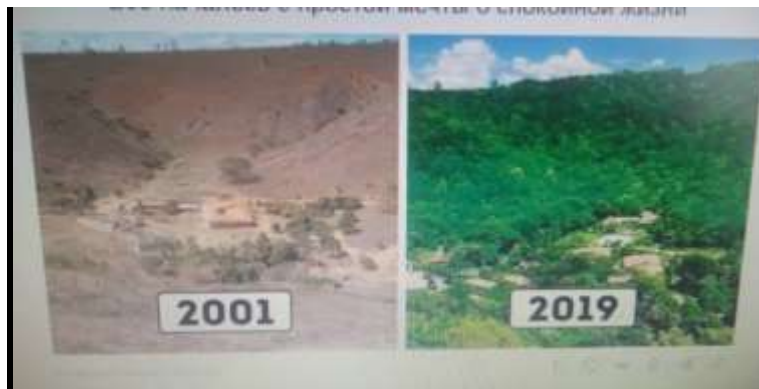
Рис. 7. Сравнительное различие вида за 20 лет

Еще одна бразильская семья в течении 20 лет высаживала деревья, и спустя 2 десятка лет тысячи диких животных и птиц вернулись домой.