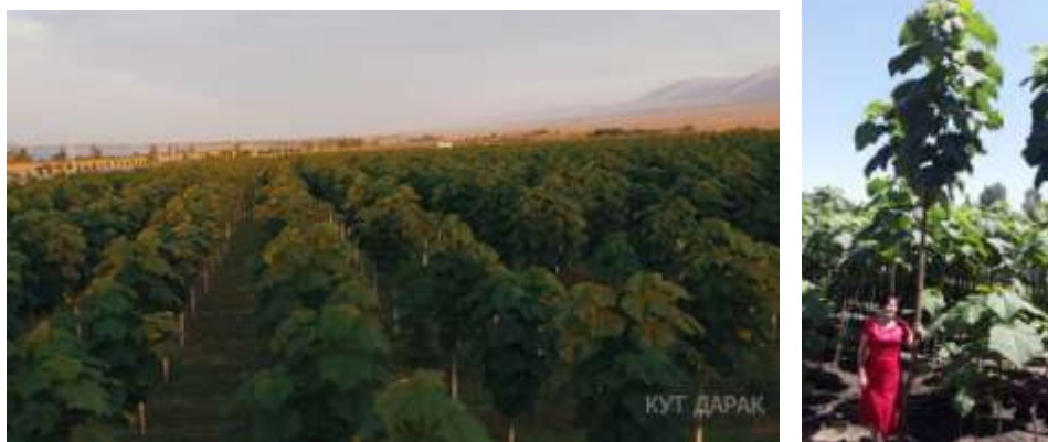
Рис. 5. Сады Павлонии на Иссык-Куле

1) У нас в Кыргызстане, предприниматели решили сажать деревья Павлония около берегов Иссык-Куля.