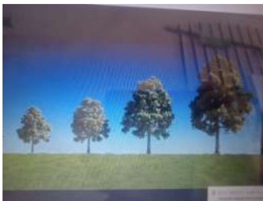
Рис. 4. Иллюстрация темпа роста деревьев

Средний темп роста деревьев составляет более 15% в год. На некоторые виды деревьев данный показатель колеблется в пределах 30% и более. (табл.1.)