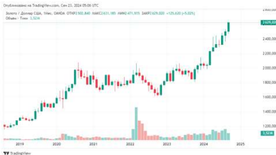
Рис. 1. Динамика изменения стоимости цены на золото в долларах с 2019г. по 2024 г.

Преимущество золота в том, что он материален, понятен, осязаем, и популярен во всем мире. Золото это самый древний и самый надёжный инструмент, популярный во все исторические времена, на сегодня динамика роста стоимости золота имеет геометрическую прогрессию.