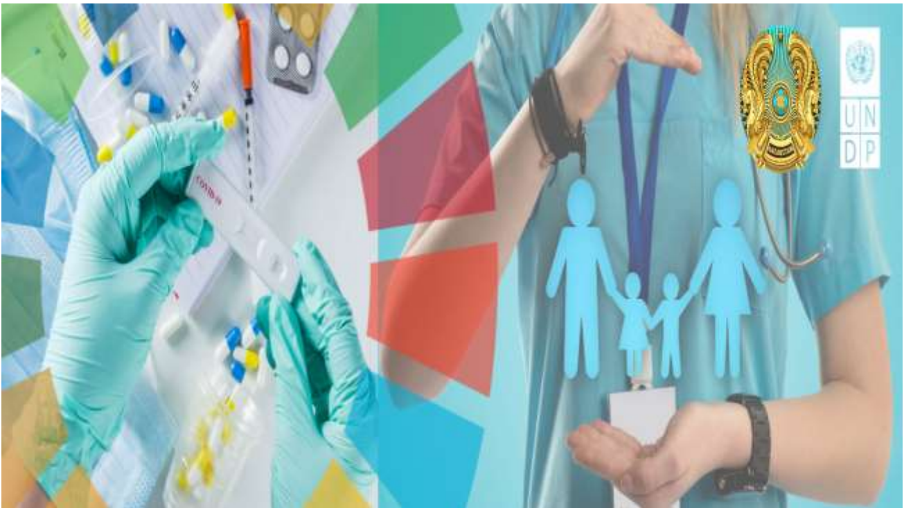
2-сүрөт. Бириккен Улуттар Уюмунун Өнүктүрүү программасы (ПРООН)

Глобалдык фонд ПРООНдун (Бириккен Улуттар Уюмунун Өнүктүрүү программасы (ПРООН) Кыргызстандагы өнүгүү боюнча алдыңкы уюм болуп саналат.) Кыргызстанда медицинага жасалма интеллект киргизүү демилгесин каржылады. Бул тууралуу Бириккен Улуттар Уюмунун сайтында маалымдалды. Сайттын маалыматына караганда, облустук кургак учукка каршы күрөшүү борборлоруна, ошондой эле Бишкектеги шаардык ооруканага тогуз көчмө рентген аппараты орнотулуп, ишке берилди. Алар жасалма интеллект функциясы менен жабдылган жана өпкөдөгү ар кандай патологиялык өзгөрүүлөрдү тезирээк жана так аныктоого мүмкүндүк берет. Бул рентген аппараттары жөнөкөй жеңил унааларга орнотулган. Алар өпкөдөгү өзгөрүүлөрдү аныктоо үчүн программаланган жана кургак учуктун пайыздык ыктымалдыгын эсептей алышат. Андыктан алар менен медайым да иштей алат жана рентгенологдун кереги жок.