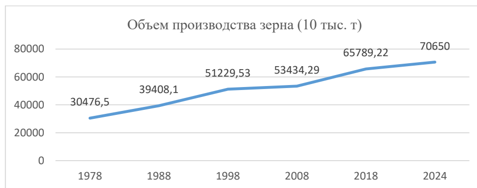
Рис. 2. Кривая производства зерна в КНР

[5]