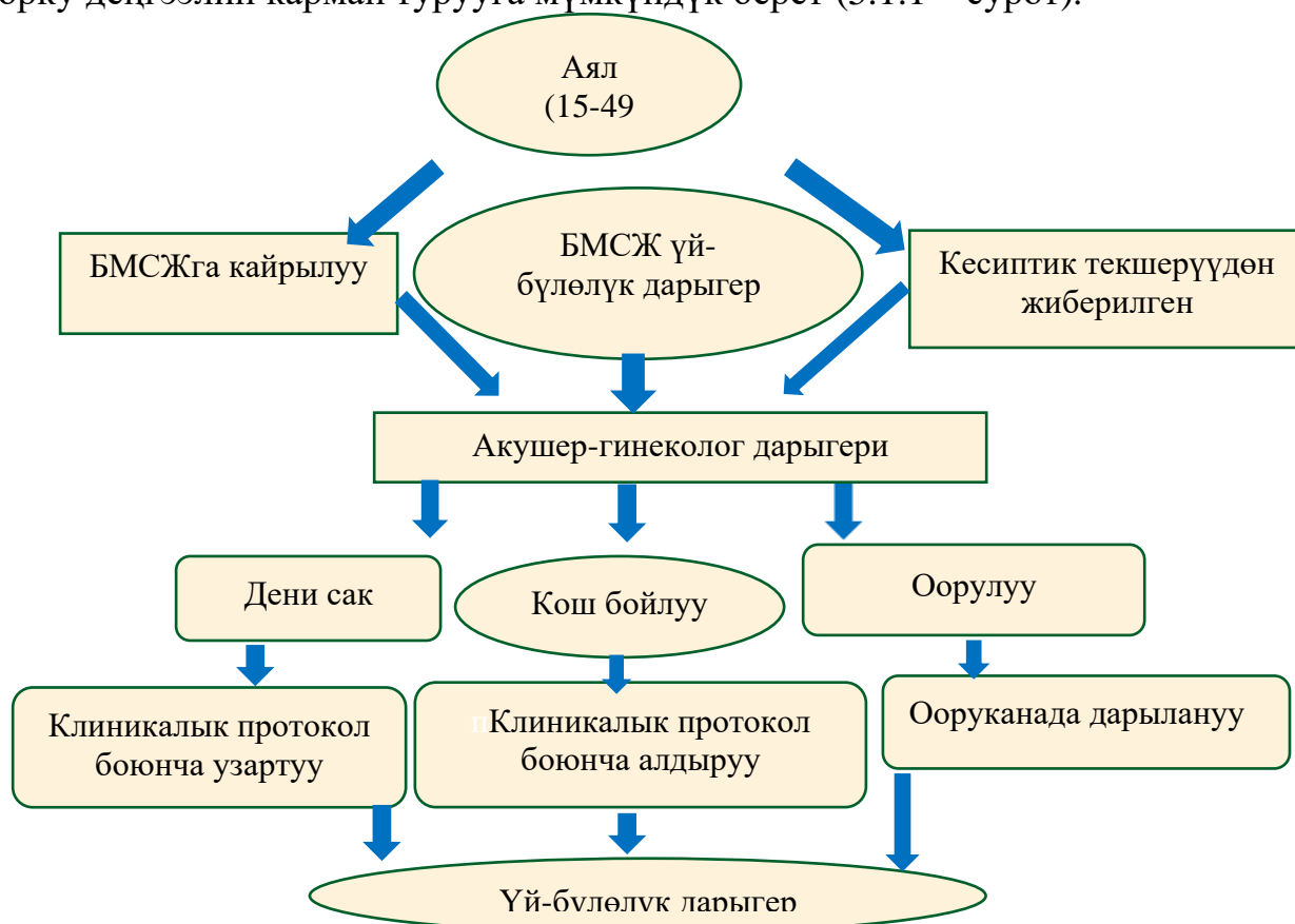
5.1.1-сурет - Төрөт курагындагы аялдарды багыттоого маршруттук түзмөк

5.1 Ош облусунун төрөт курагындагы аялдарга медициналык жардам көрсөтүү алгоритми. Сапаттуу медициналык жардамды камсыздоо жана клиникалык сунуштарды ишке ашыруу үчүн Ош облусунда төрөт курагындагы аялдарга медициналык жардам көрсөтүү алгоритми иштелип чыккан. Бул алгоритм төрөт курагындагы аялдарга медициналык жардам көрсөтүүнү стандартташтырууга жана сапатын жакшыртууга жардам берет. Клиникалык практиканы жөнөкөйлөштүрүүгө, клиникалык сунуштамаларды сактоого жана кызмат көрсөтүүнүн натыйжалуулугун жогорулатууга багытталган. Алгоритмдин өзгөрүп жаткан клиникалык стандарттарга жана эпидемиологиялык кырдаалга ылайык үзгүлтүксүз жаңыланышы калкка медициналык жардам көрсөтүүнүн жогорку деңгээлин кармап турууга мүмкүндүк берет (5.1.1 – сурет).