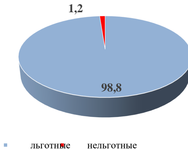
Рисунок 3. Удельный вес внешнего кредита по видам кредитования, %

При проведении аналитической работы был сделан вывод о том, что в основном в структуре внешнего долга нашей страны преобладают кредиты, что отображено на рисунке 3.