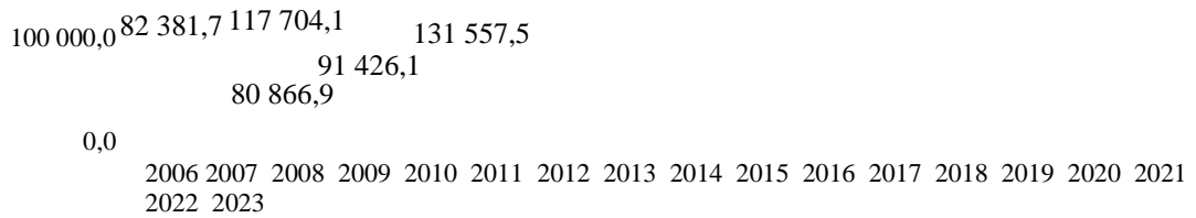
Рисунок 1. Динамика государственного долга Кыргызской Республики, млн. сом. *рисунок составлен по данным НСК КР [3]

Из предоставленных данных видно, что государственный долг Кыргызстана с 2006 по 2023 год непрерывно увеличивался, начиная с уровня 82 381,7 млн. сомов в 2006 году и достигая 559 503,6 млн. сомов в 2023 году.