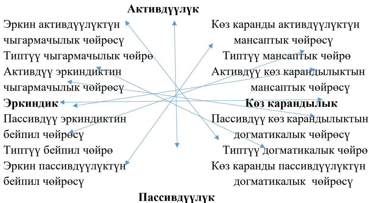
2-сүрөт. Билим берүү чөйрөсүнүн мүмкүн болуучу вектордук моделдеринин толук спектри