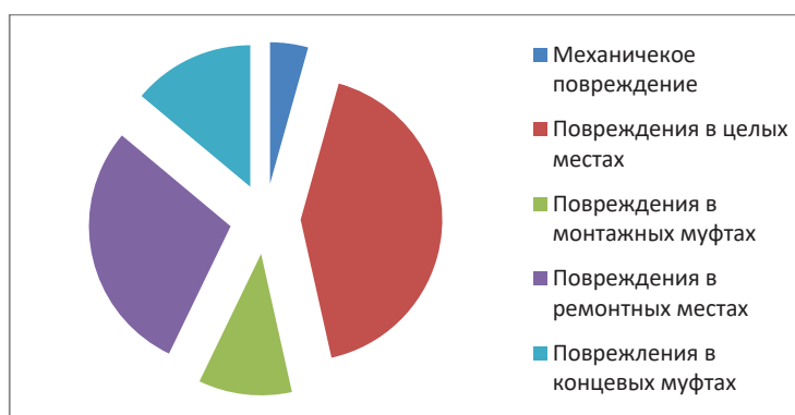
Рисунок 3 – Диаграмма причин повреждения высоковольтных кабельных линий за 9 месяцев 2023 г.