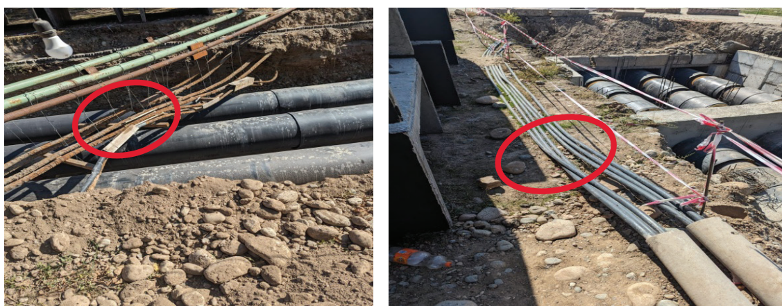
Рисунок 1 – Трассы абонентских кабельных линий и теплотрасс по ул. 7 апреля, г. Бишкек

Пути уменьшения повреждаемости кабельной сети. Выбор трассы для реконструкции существующих и строительству новых кольцующих кабельных линий необходимо осуществлять совместно с МП «Бишкекглавархитектура». При этом рекомендуется выбирать оптимальные трассы кабельных линий с учетом затрат на эксплуатационно-ремонтные работы в соответствии с п. гл. 2.3.25; 2.3.30 «ПУЭ» [5].