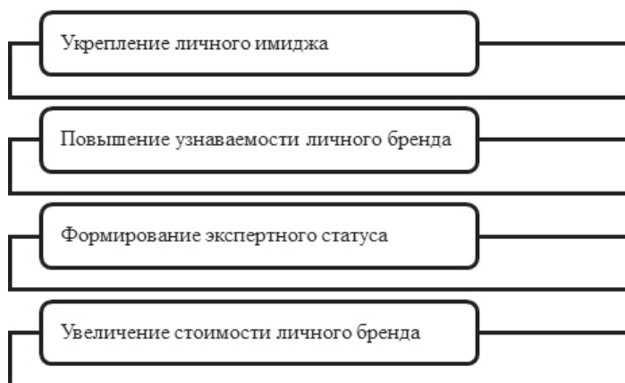
Рисунок 2 – Цели личного бренда руководителя