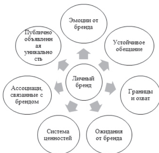
Рисунок 1 – Основные элементы, формирующие личный бренд