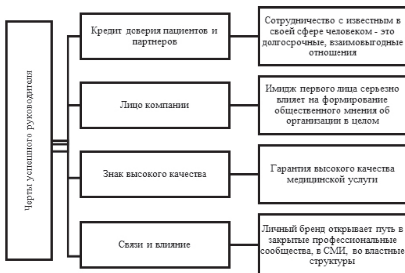
Рисунок 5 – Черты успешного руководителя организации здравоохранения