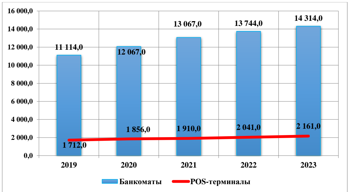
Рис. 3. Динамика количества банкоматов и POS-терминалов за 2019-2023 гг. [4]

Из предоставленных данных видно (рис. 3), что в конце 2023 года в Кыргызской Республике было широко распространено использование банковских платежных карт. Всего было доступно 2041 банкомат и 16 252 POS-терминала, на которых можно было проводить операции с картами различных платежных систем [2].