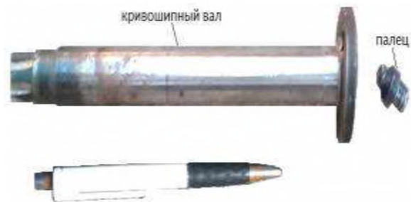
Рисунок 3. Поломка кривошипного вала перфоратора.

Затем был принят другой вариант, где палец и кривошипный вал предлагалось изготавливать как одно целое. Дальнейшая работа перфоратора с предложенной конструкцией пальца и кривошипного вала показали правильность принятого решения и оставались работоспособными. В дальнейших лабораторных испытаниях нарушение работоспособности предложенной конструкции не наблюдалось, таким образом, предложенный вариант конструкции пальца и кривошипного вала был рекомендован к изготовлению.