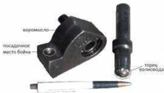
Рисунок 2. Поломки коромысла и волновода опытного образца перфоратора

Во время разборки поворотного механизма также была обнаружена поломка пальца кривошипного вала. Причиной поломки является особое соединение, которое не выдерживает циклические нагрузки. В течение 2 часов 47 минут испытаний перфоратора гнездо пальца кривошипного вала пришло в непригодность, палец выскочил из гнезда (рис. 3). При анализе угловых скоростей элементов перфоратора по результатам математического моделирования были выявлены динамические амплитуды колебаний угловой скорости третьего звена – кривошипного вала кривошипно-коромыслового механизма поворотного узла. Результаты лабораторных испытаний опытного образца доказали эти выводы, получение по результатам исследования по математической модели. Также выявлены нарушения в поворотном цикле.