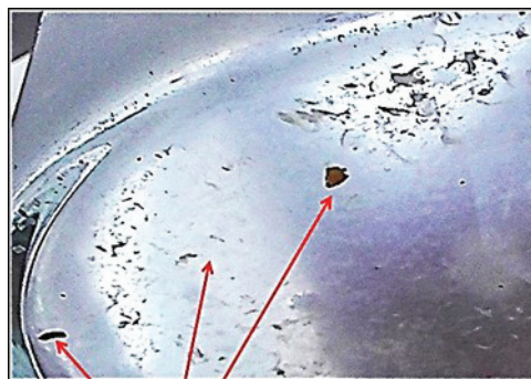
Рисунок 2 – Колос, удаленный из клетки левого нижнедолевого бронха