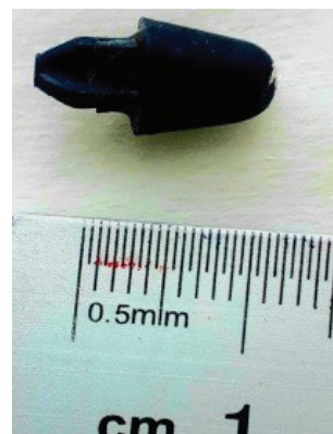
Рисунок 6 – Иностранное тело (часть игрушки)

После удаления инородного тела без выписки больного три раза проведена лечебно-санационная бронхоскопия. Ребенок находится под диспансерным наблюдением, получая периодически санационную бронхоскопию, рассасывающее лечение, с целью профилактики бронхоэктаза легкого.