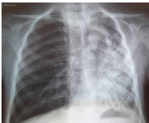
Рисунок 5 – Обзорная рентгенограмма грудной клетки при поступлении