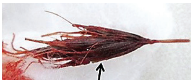
Рисунок 4 – Колос, удаленный из клетки левого нижнедолевого бронха

ЭКГ – ЧСС 102 уд. в 1 мин, неполная блокада правой ножки пучка Гисса. Обзорная рентгенография органов грудной клетки в двух проекциях (рисунок 1), отмечается деформация бронхолегочного рисунка, снижение пневматизации в нижневнутреннем отделе правого легкого.