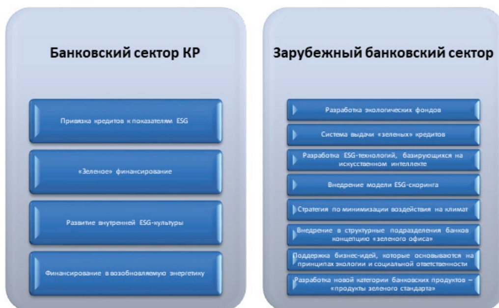
Рисунок 1 – Достижения банковского сектора КР и зарубежных стран в области реализации ESG

На сегодняшний день банком проводятся работы по реализации ЦУР посредством разработки и внедрения проектов, направленных на минимизацию выбросов CO 2 , строительство возобновляемых источников энергии, реализацию программ по обеспечению продовольственной безопасности, сохранение водных ресурсов страны, поддержку предприятий по переработке вторсырья и многое другое.