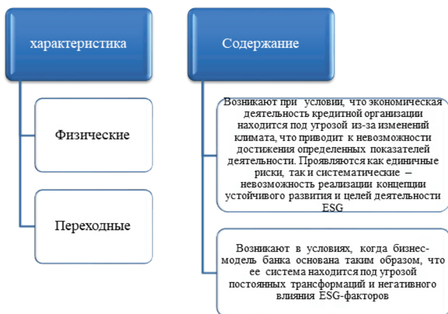
Рисунок 4 – Физические и переходные риски

компания столкнется с необратимыми последствиями. Следовательно, важно заблаговременно определить угрозу наступления ESG-рисков, а для своевременной их идентификации нужно анализировать не только степень проработанности ESG-повестки, но и проанализировать уже отлаженный процесс управления рисками в целом. Результатом такого анализа станет система