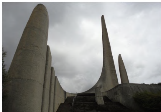
Африканс тилине арналган айкел Түштүк Африка Республикасы 1975-ж