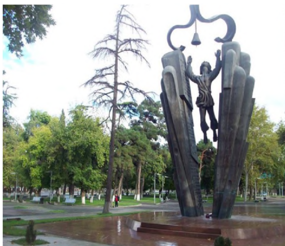
«Деда Эна» («Эне тил») Грузия, Тбилиси шаары 1978-ж