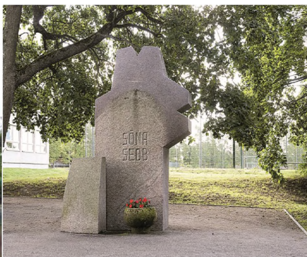
Эстония Кадрина шаары Sõna seob" (Сөз байланыштырат). 1994-ж

Борбор калаабыздын маданий мекемелеринин алдына этнопактардын бирине эне тилге арналган эстелик тургузуу. Болжолдуу макети: