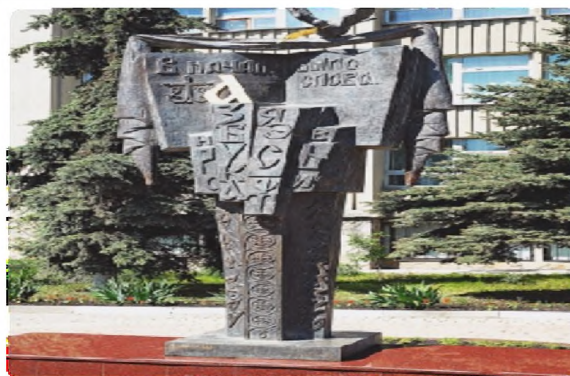
Орус тилине арналган айкел Белгород шаары 2007-жыл