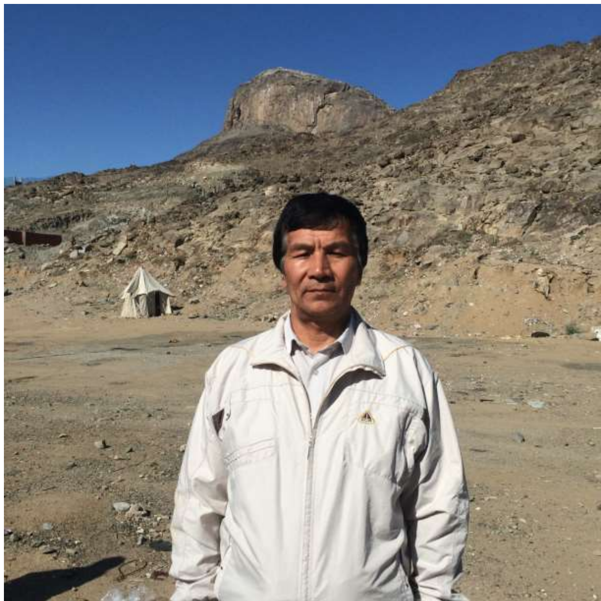
Гора Нур и пещера Хира. Здесь начинались великие перемены и великая миссия