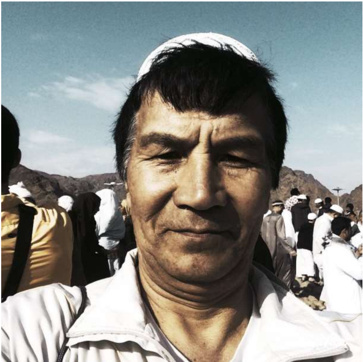
Гора Ухуд: уроки пророческих наставлений