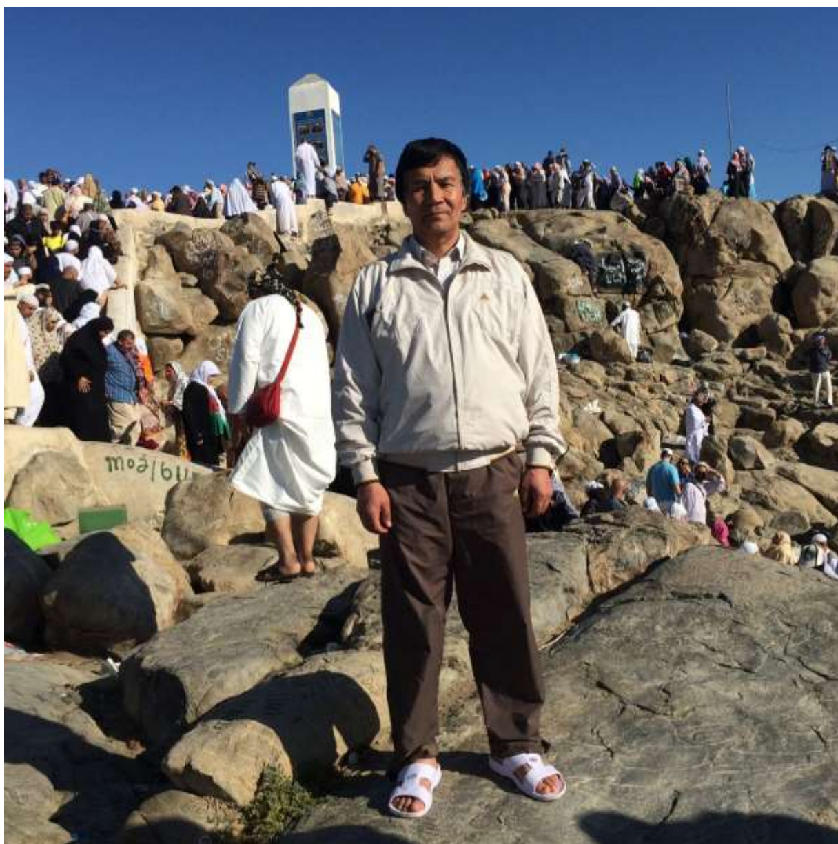
Знаменитая гора Арафат