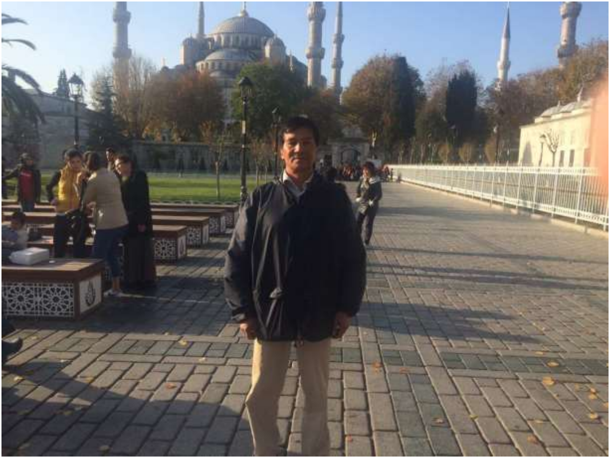
Перед Голубой мечетью в Стамбуле