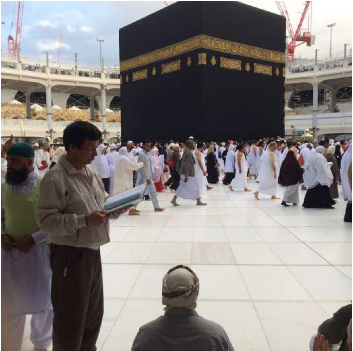
Пути Каабы: дорога к самому себе