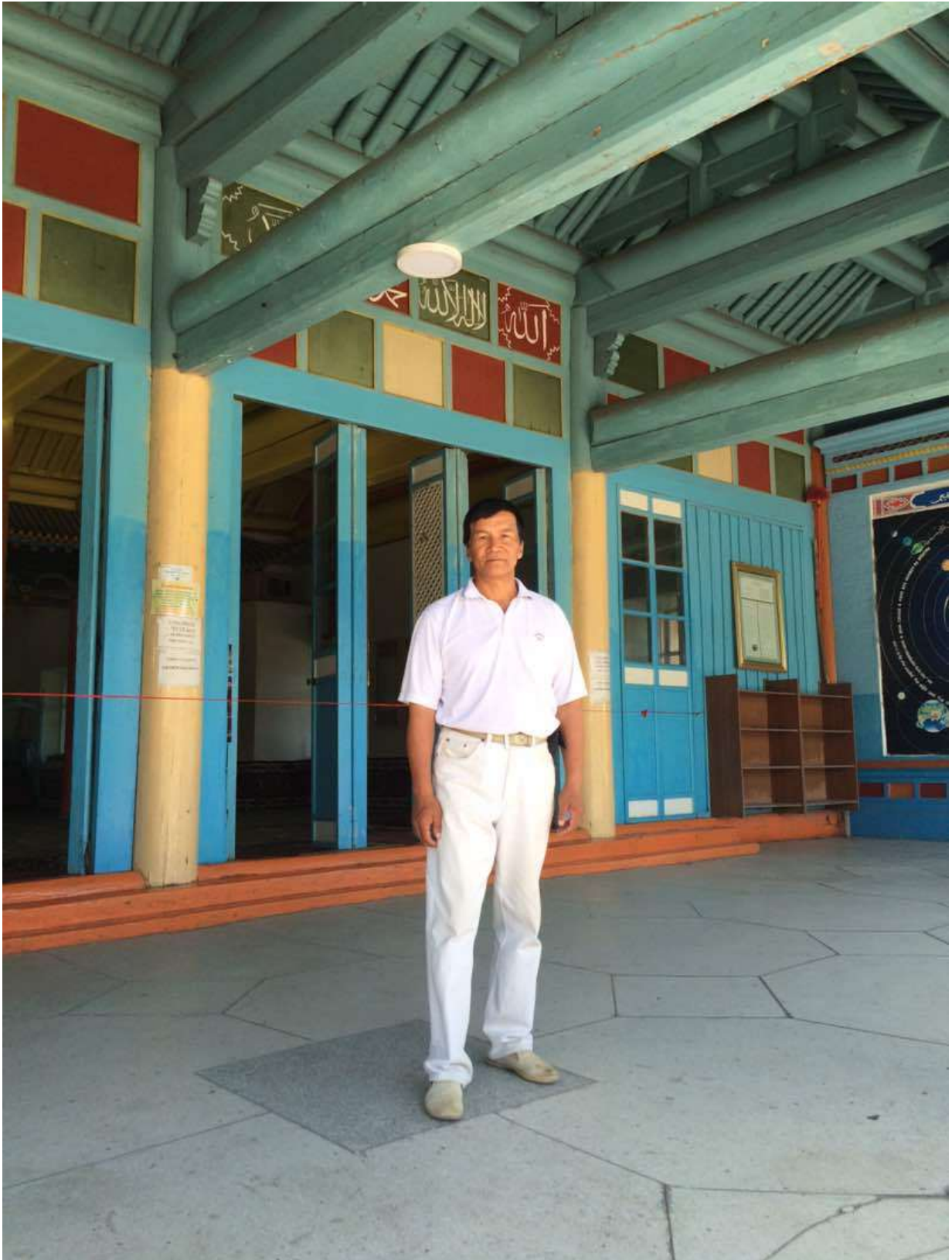
Храм, куда приходили отцы