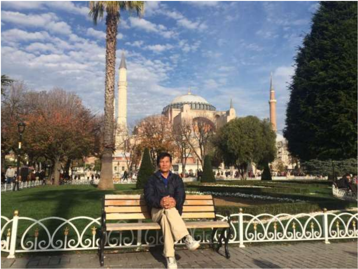
На площади Султан-Ахмед на фоне знаменитой Ая-Софии