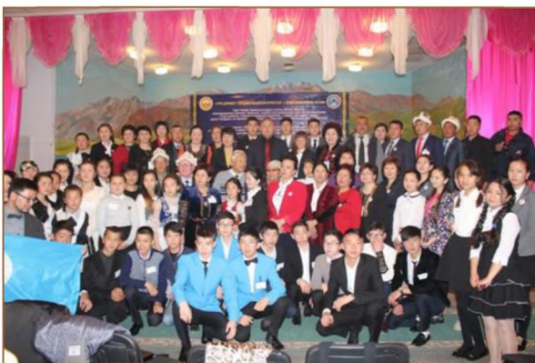
«Түрк дүйнөсү: Тарыхый-маданий мурастар — элдин көөнөрбөс кенчи» эл аралык илимий-тажрыйбалык конференциясынын катышуучулары. 2016-жылдын 18 марты.

Бул эл аралык ИТКга Кыргызстандын Бишкек жана Каракол шаарларынан, Нарын, Ысык-Көл, Чүй, Талас, Ош жана Баткен облустарынан, Казакстан Республикасынын Түркстан шаарынан жана Орусия Федерациясынын Саха (Якут) Республикасынан келишкен 98 делегат, анын ичинде 77 окуучу, 16 мугалим, 5 окумуштуу катышты.