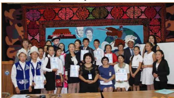
«Түрк дүйнөсү: Кептин көркү — тил, ойдун көркү — сөз» конференциясынын катышуучулары. 2015-жылдын 14-августу.

2015-жылдын 14–15-августунда Кыргыз билим берүү академиясынын социалдык-гуманитардык предметтер лабораториясы Талас облусунун Талас районундагы Абдылдабек Эсенбеков атындагы орто мектеби менен биргеликте уюштурган жалпы билим берүү уюмдардын (мектеп, гимназия, лицей) окуучуларынын жана мугалимдеринин кезектеги «Түрк дүйнөсү: Кептин көркү — тил, ойдун көркү — сөз» деген темадагы илимий-тажрыйбалык конференциясы Кыргыз улуттук «Манас-Ордо» комплексинде болуп өттү.