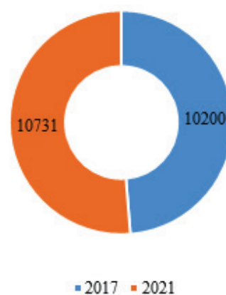
Рисунок 1 – Заработная плата одного сотрудника в сфере туризма

Также возросла и численность работников в сфере туризма. На 2021 год она составила 7,2 тыс. человек, наибольшее число из них занято в санаторно-курортных учреждениях, что составляет 23,6 % [2]. Кроме того, увеличилась и заработная плата сотрудников в сфере туризма (рисунок 1).