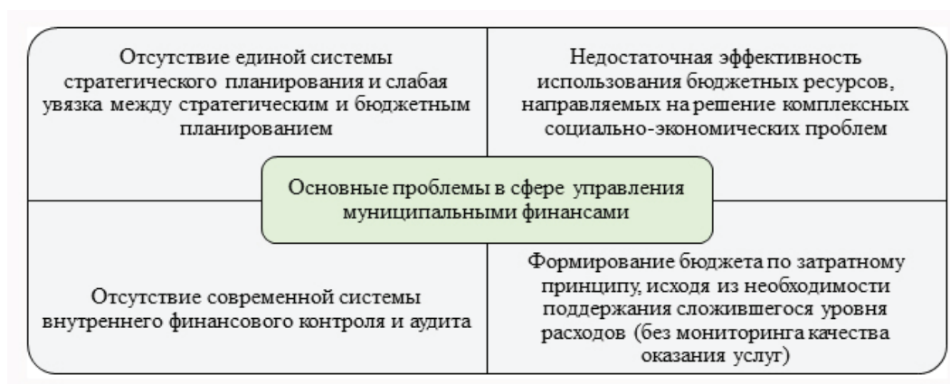
Рисунок 2 – Основные проблемы в сфере управления муниципальными финансами