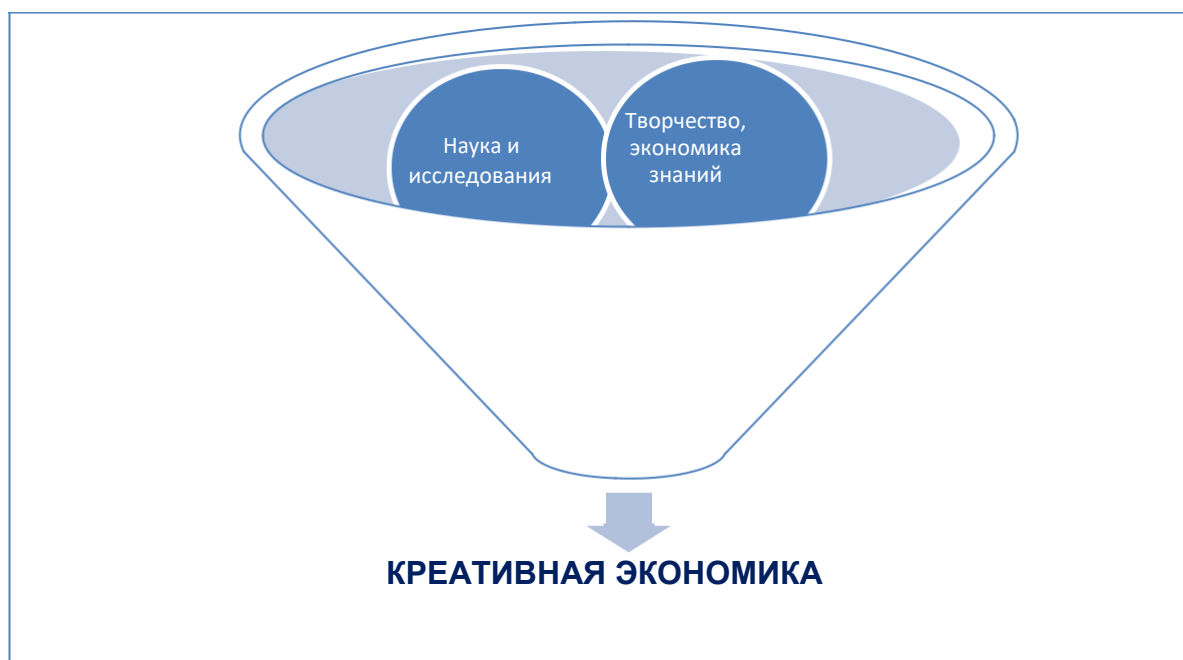
Рисунок 1. Составляющие креативной экономики

Креативная экономика охватывает такие понятия, как интеллектуальная собственность и инновации, наука и исследования, творчество, экономика знаний и культура, а основой являются креативные индустрии (рис.№1).