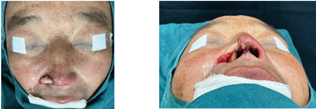
Рисунок 1 – Дефект кончика носа закрыт носогубным лоскутом (вид сразу после операции)