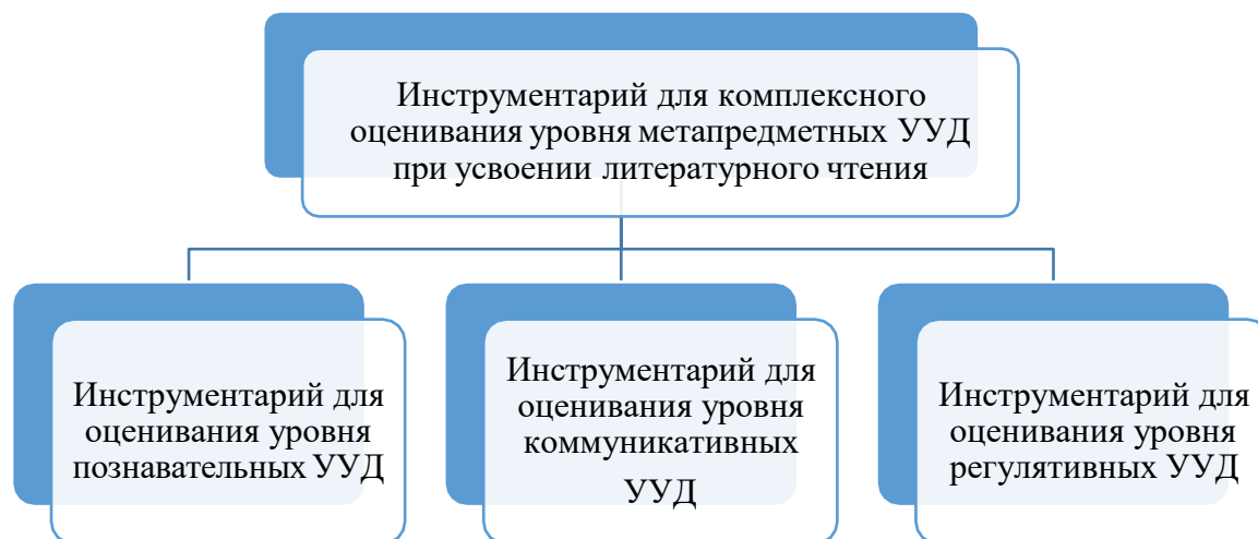
Рис.3. Структура инструментария по определению уровня метапредметных УУД при усвоении литературного чтения

каждого из компонентов метапредметных действий (познавательных, коммуникативных и регулятивных) будет различно.