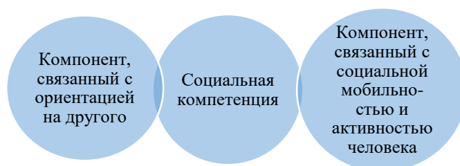
Рис. 1. Компонентный состав социальной компетенции

Компонентный состав социальной компетенции, с точки зрения различных авторов, разнообразен. В рамках нашего исследования представлен компонентный состав социальной компетенции, предложенный Т.Г. Пушкаревой и Ю.А. Трифоновой [2012] (рис. 1). Принимая во внимание направленность подготовки студентов, считаем целесообразным включить в ее состав компонент, связанный с ориентацией на другого, и компонент, связанный с социальной мобильностью и активностью человека, поскольку они наиболее характерны для сферы туризма и сервиса [Подласый И.П., 2015].