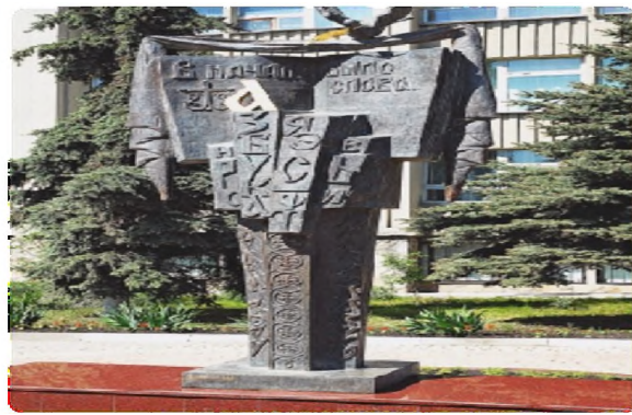
Орус тилине арналган айкел Белгород шаары 2007-жыл