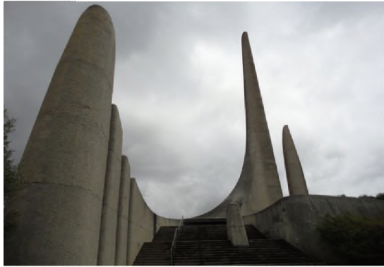
Африканс тилине арналган айкел Түштүк Африка Республикасы 1975-ж