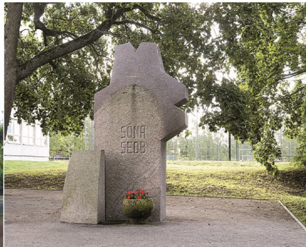
Эстония Кадрина шаары Sõna seob" (Сөз байланыштырат). 1994-ж

Борбор калаабыздын маданий мекемелеринин алдына этнопактардын бирине эне тилге арналган эстелик тургузуу. Болжолдуу макети: