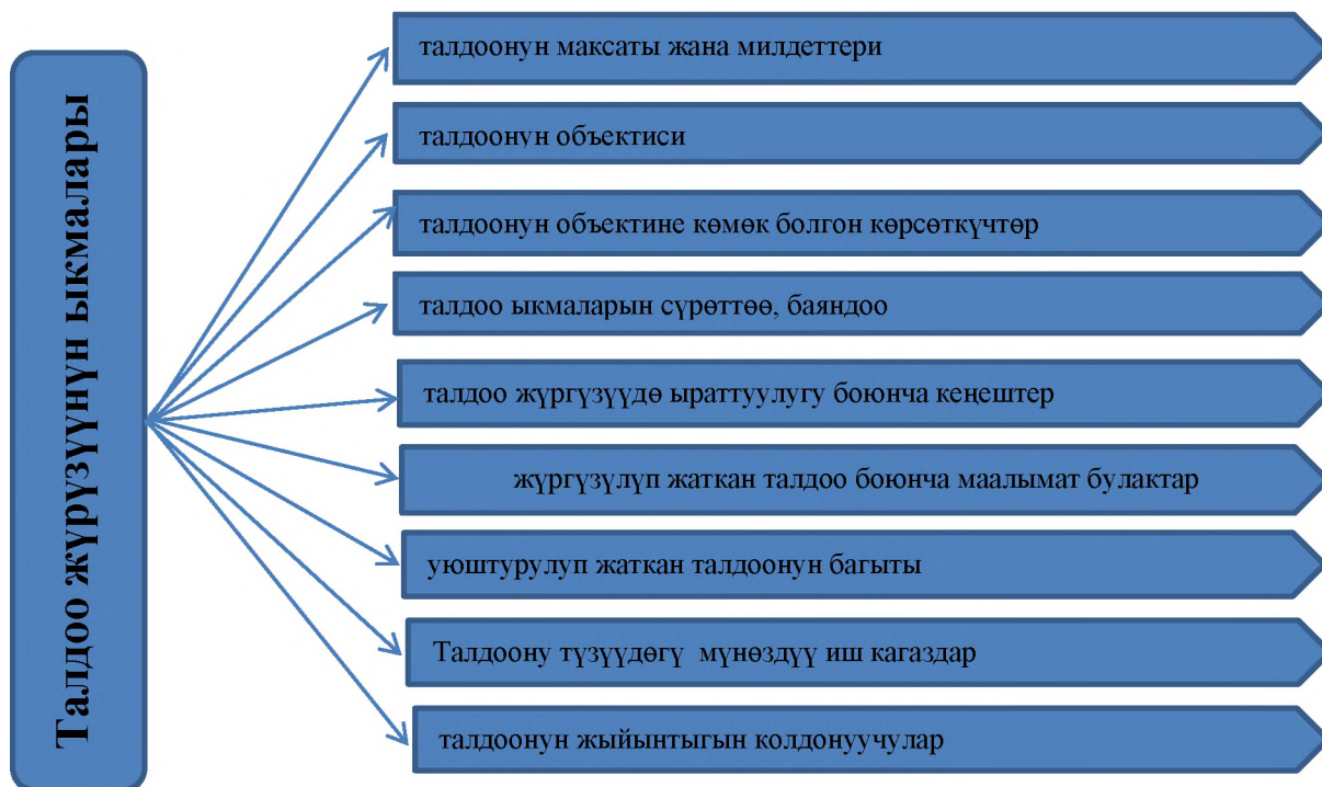
2-сүрөт. Талдоо жоргузүүнүн ыкмалары

Ыкма – бүгүнкү күндө мекемедеги кандайдыр бир жумушту аткарууга багытталган тартиптердин, тийиштүү ыкмалардын жыйындысы деп түшүнөбүз. Ал эми экономикалык талдоодо, максаттуу түрдө мекеменин экономикалык жана аналитикалык тартиптеринин жалпы жыйындысы – ыкма деп аталат. Адатта төмөнкүдөй бөлүнөт: