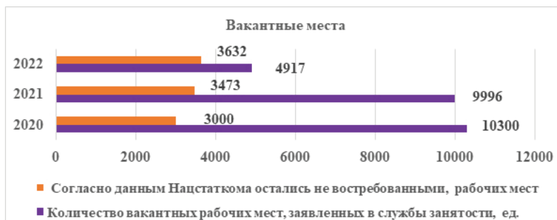
Рисунок 3 – Вакантные места