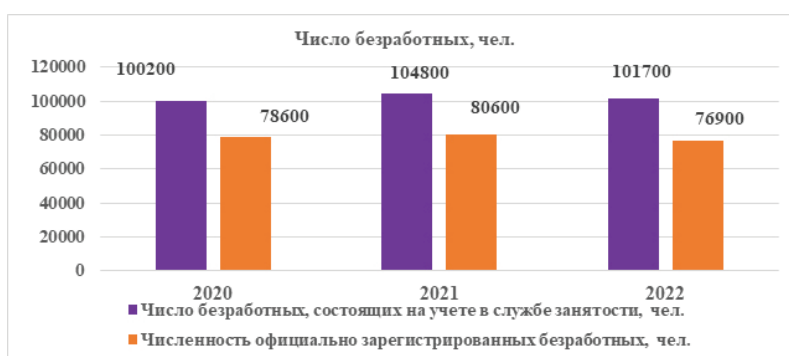
Рисунок 2 – Число безработных