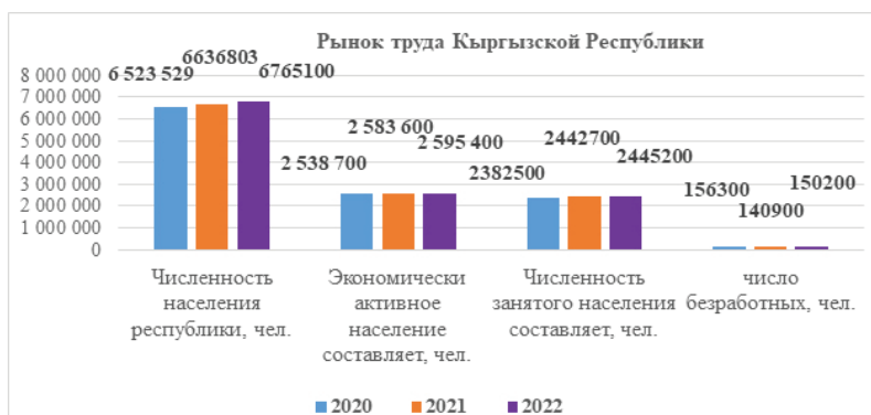
Рисунок 1 – Рынок труда Кыргызской Республики на 1 апреля 2022 года