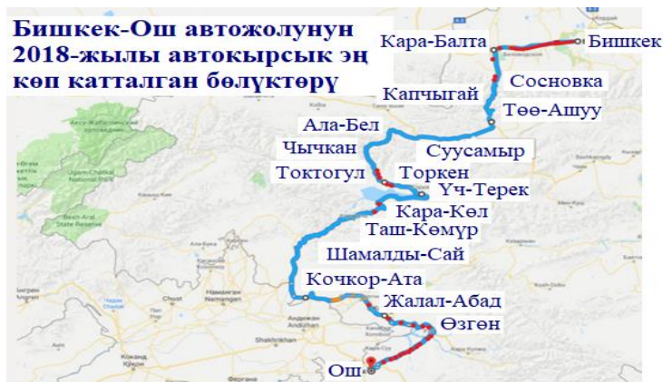
2-сүрөт. Автожолдогу кырсыктар көп орун алган калктуу чөлкөмдөр.

Көрүнүп тургандай, автокырсыктардын көбү ири шаарлар: Бишкек менен Кара-Балтанын, Ош менен Жалал-Абаддын ортолорундагы аралыктарда, кичи шаарлар: Кара-Көл менен Таш-Көмүрдүн ортосундагы аралык та, ири айылдар: Торкен менен Токтогулдун