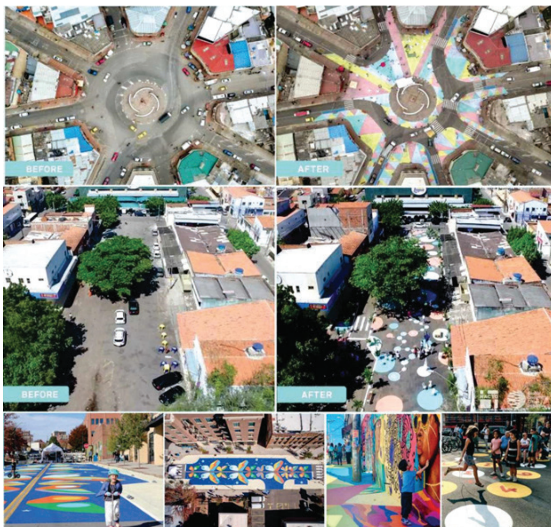
Рисунок 5 – Примеры преобразования пространства с помощью фресок. Местонахождение: Богота (Колумбия); Форталеза (Бразилия); Сан-Паулу (Бразилия); Милан (Италия) [8]

5. Изображение муралов на фасадах зданий или прикрепленные фрески с изображением игр, или других игровых элементов (рисунок 5).