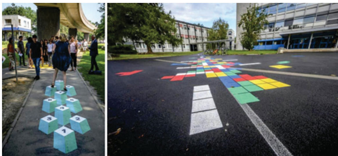
Рисунок 4 – В кампусе Университета Лилля, в г. Вильнёв-д'Аск (Франция) были созданы две тестовые схемы в попытке измерить удовольствие, получаемое во время физических упражнений [6]