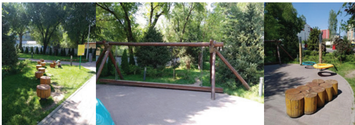
Рисунок 8 – Игровая площадка вдоль ул. Тимирязева, уг. ул. Байтурсынова