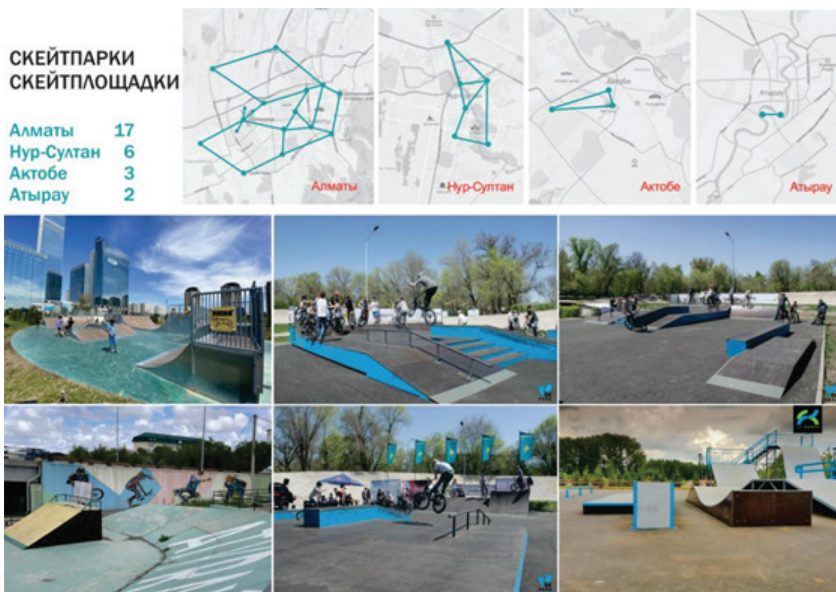
Рисунок 9 – Скейтплощадки в городах Казахстана (Нур-Султан, Алматы, Актобе, Атырау) [10–13]

Общественные пространства в городах Казахстана постепенно приобретают знаковые места, куда горожане с удовольствием возвращаются.