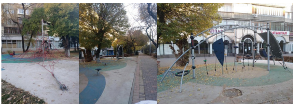
Рисунок 7 – Игровая площадка вдоль ул. Богенбай батыра, угол ул. Масанчи