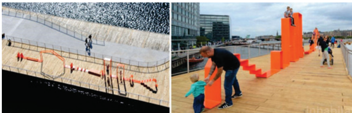
Рисунок 2 – Аллея прибрежного парка Кальвебод Брюгге в Копенгагене [3]