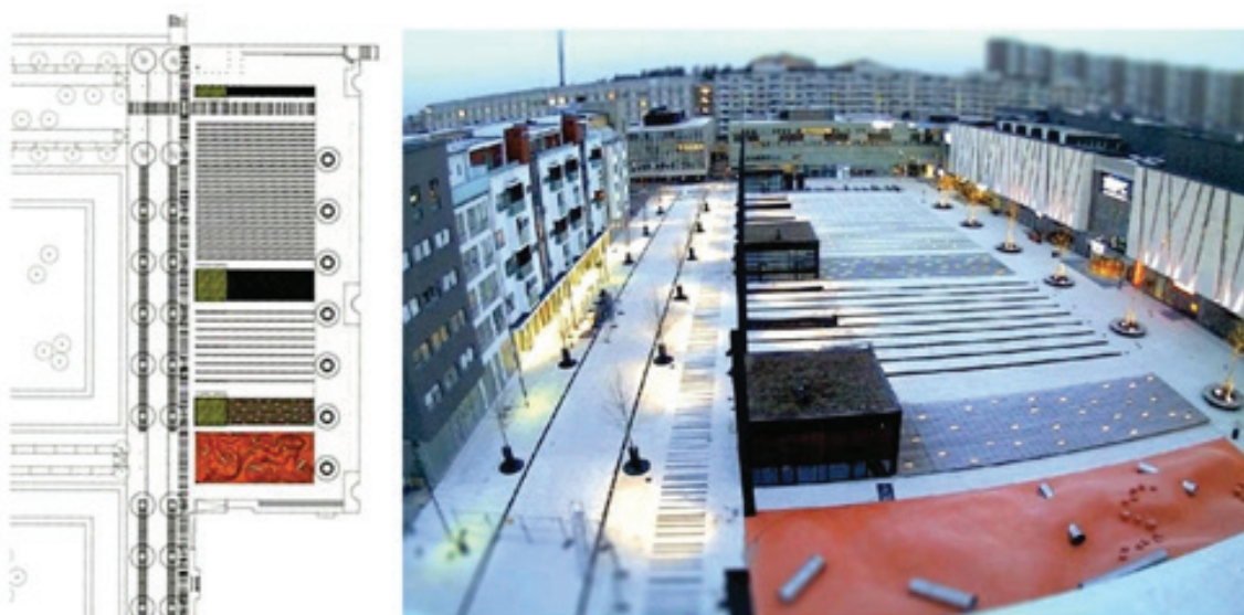
Рисунок 1 – Игровая площадка Täby Torg в Швеции [1]