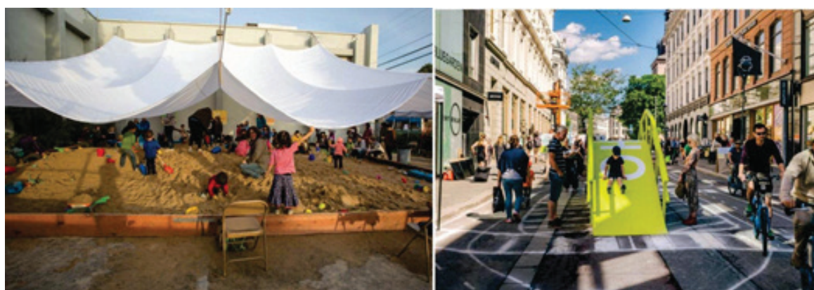
Рисунок 3 – Детский музей Habitol в Беркли, Калифорния, превратил парковку площадью 3600 кв. футов в гигантскую песочницу, которая за семь дней привлекла более 1700 детей (а); улицы, свободные от автомобилей в Осло, Норвегия (б) [4, 5]