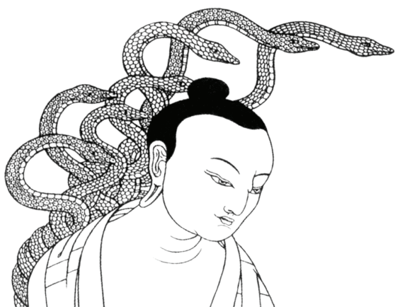
Рисунок 1 – Изображение Арьи Нагарджуны [2]

В-третьих, все объекты зависят от конвенции (наименования). Мы постоянно получаем и организуем огромное количество информации – цвет, форма, фактура, воспоминания и ассоциации. Собирая атрибуты вместе, мы именуем объект, тем самым конструируя его независимое существование. Наделяя независимым существованием сконструированный объект, мы