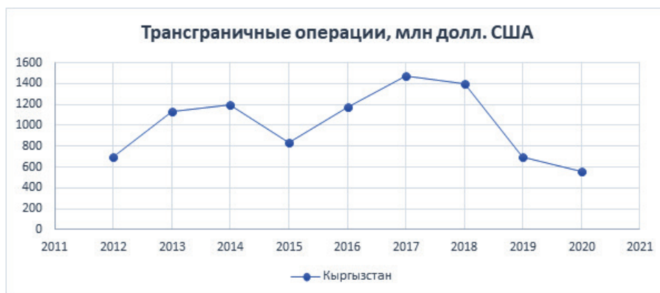
Рисунок 4 – Трансграничные операции (сумма переводов из России в Кыргызстан)**