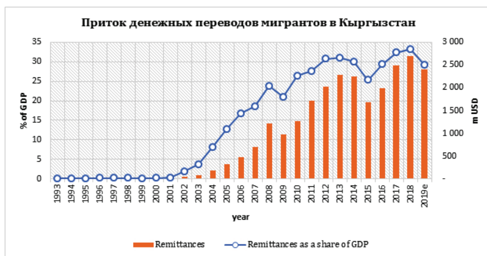
Рисунок 3 – Приток денежных переводов мигрантов в долларах США и как доля в % от ВВП Кыргызстана*