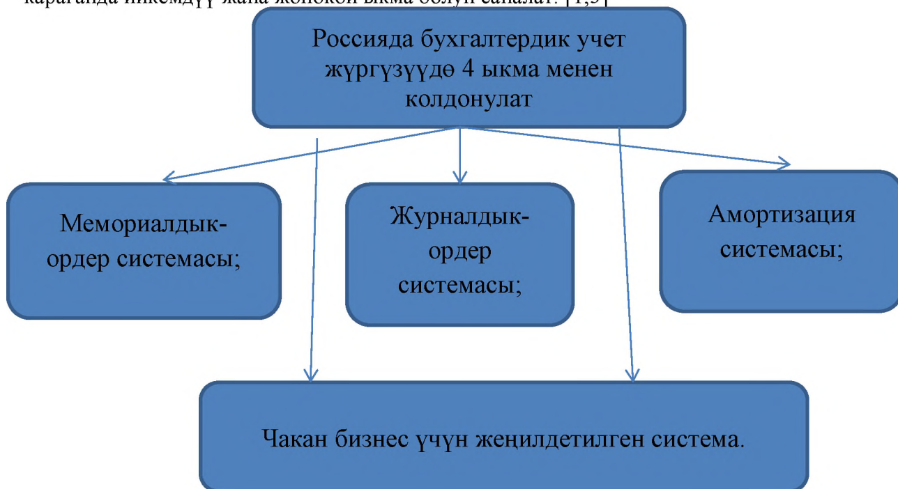
2 сүрөт. Россиядагы бухгалтердик эсептин жүргүзүүдөгү ыкмалар

Барынан кеңири тарган бул журнальная система ыкмасы. Бул системада баштапкы иш кагаздарын каттоо журналдарда катталып андан кийин Башкы китепке түшүрүлөт, же болбосо өзүнчө китептерге түшүрүлөт. Көбүн эсе жалпы журнал жана бир канча журнал көп жүргүзүлүүчү операциялар боюнча түзүлөт. Бул система мемориалдык-ордердик системага караганда ийкемдүү жана жөнөкөй ыкма болуп саналат. [1;3]