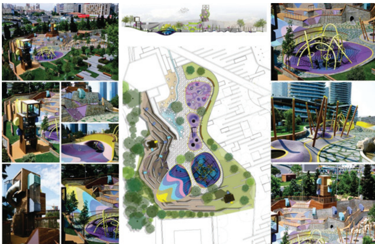
Рисунок 5 – Игровая зона в общественном Центре Zorlu, г. Стамбул (Турция) [12]

Благодаря разнообразной цветовой палитре и, несмотря на свои цвета и необычные формы, детская площадка прекрасно сливается с окружающим пейзажем, адаптируется под функцию игровой среды для детей и объединяет все объекты досуга (рисунок 5).