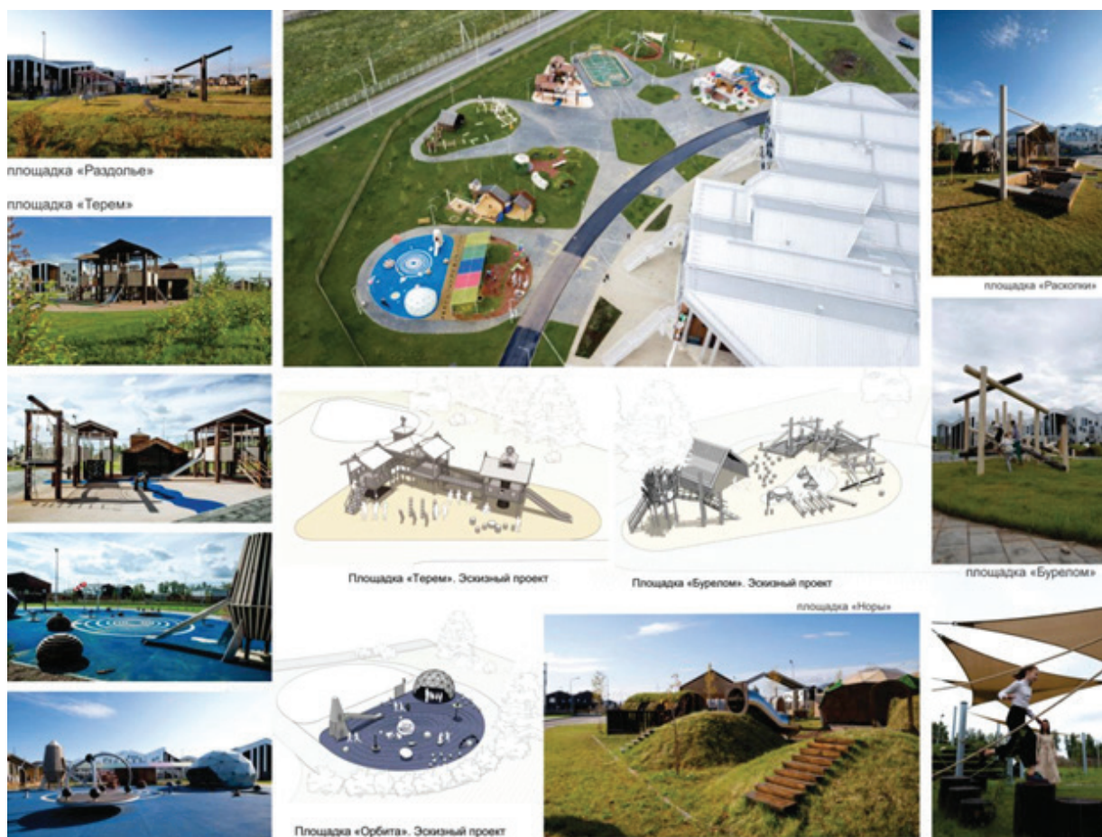
Рисунок 3 – Игровые площадки в образовательном комплексе «Точка будущего», г. Иркутск (Россия) [10]

Элементы приключенческой площадки можно встретить на площадке «Бурелом». Здесь хаотично разбросаны брёвна, из которых в меру своей фантазии можно выстраивать различные фигуры. По кругу площадки выстроен маршрут из бревенчатых препятствий, ведущий к комплексу с деревянными гнездами на возвышении.