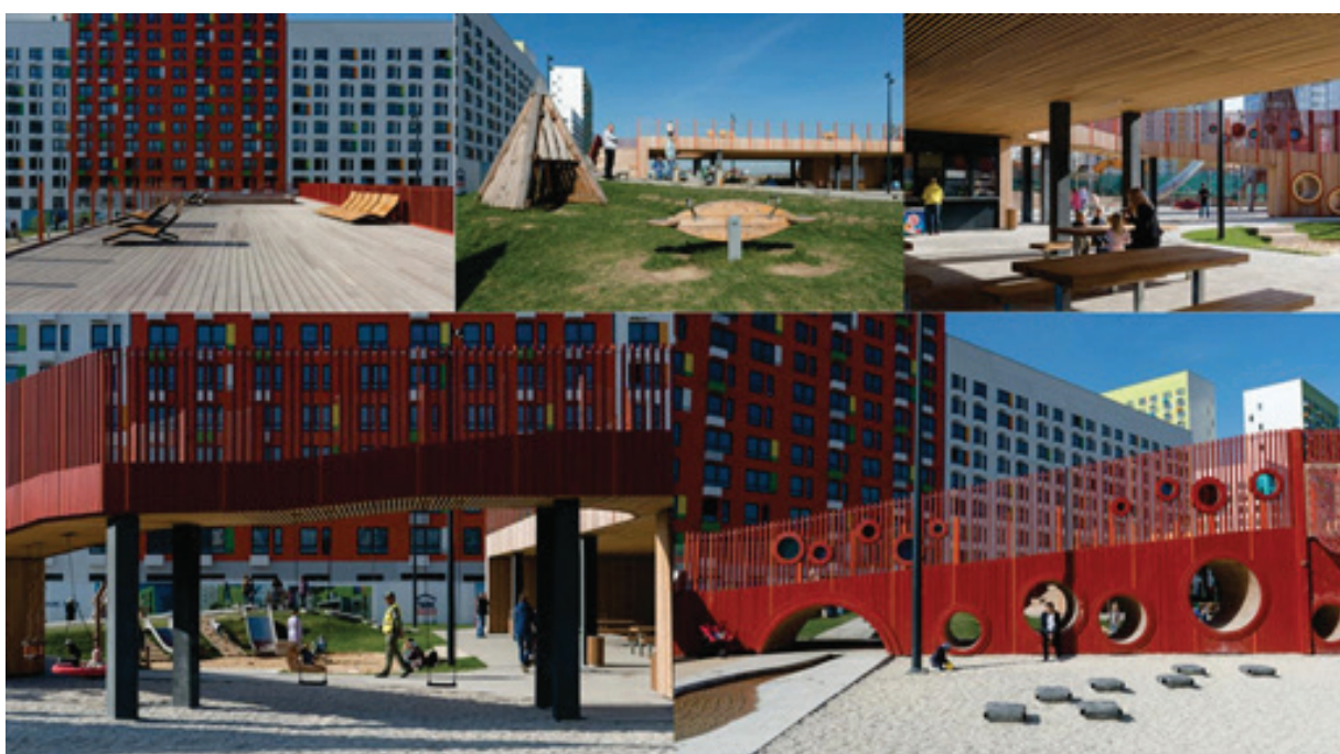
Рисунок 2 – Детская игровая площадка «Пирамиды», г. Москва [9]