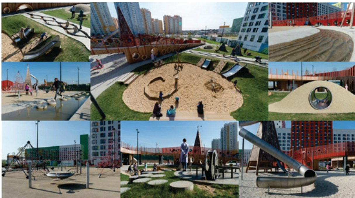
Рисунок 1 – Детская игровая площадка «Пирамиды», г. Москва [8]