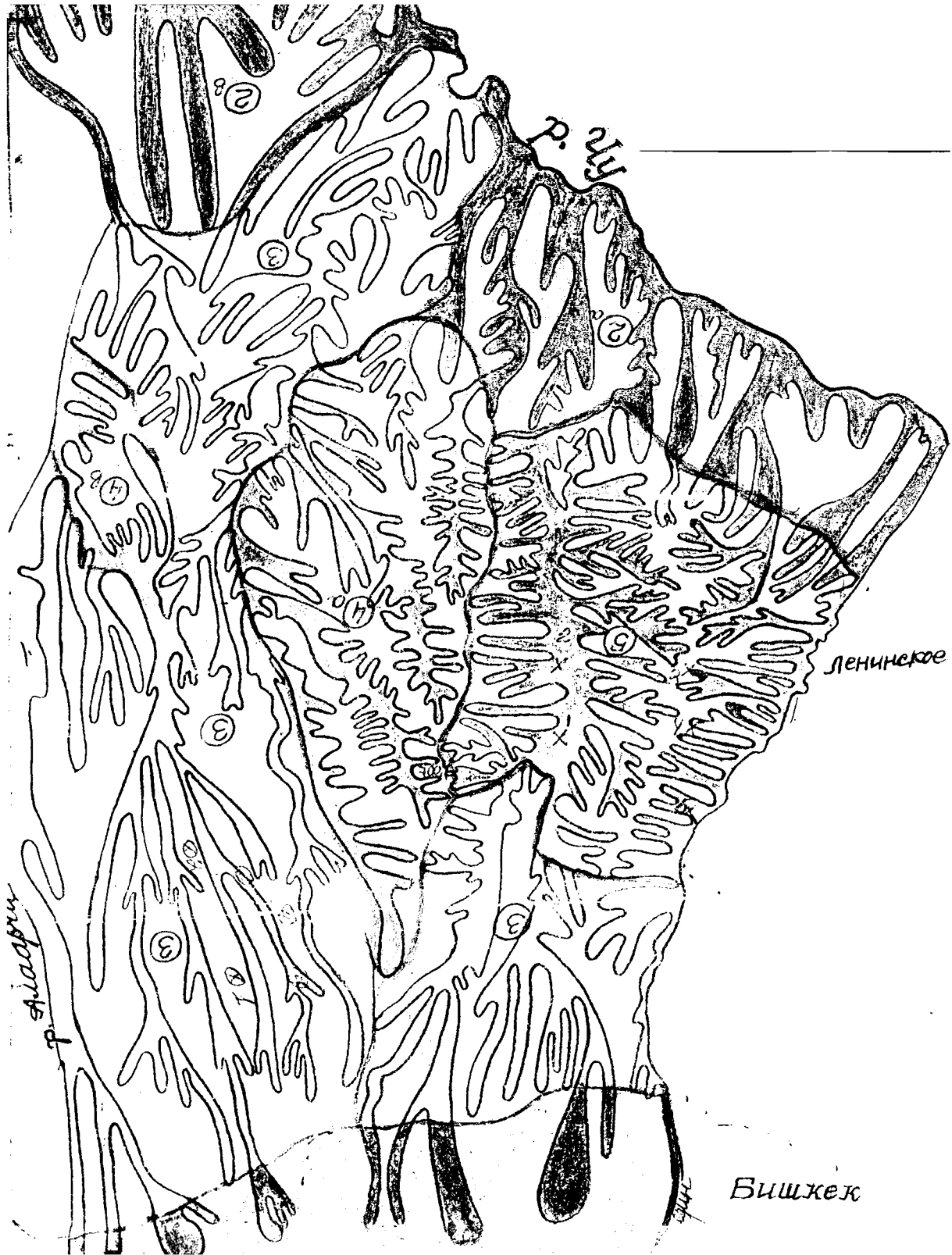
Рис. 2 – Фрагмент карты пластики рельефа Чуйской долины