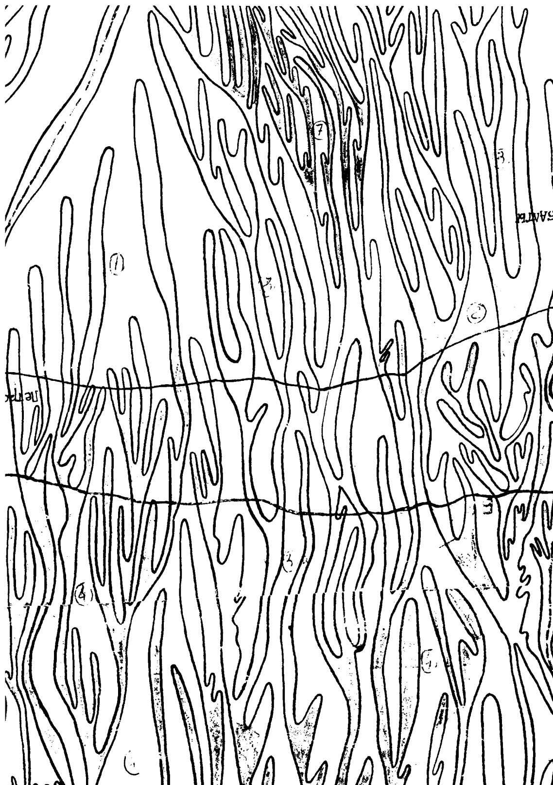
Рис. 3 – Фрагмент карты пластики рельефа