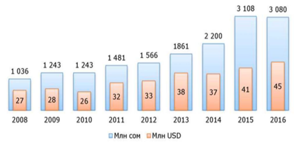
Рис 1. Динамика изменения рынка консалтинговых услуг в Кыргызстане[7]

Согласно исследованию, проведенному ОЭСР, рынок консалтинговых услуг ориентирован в основном на крупные предприятия в связи с возможностью выделять средства на оплату этих услуг. Исследование показало, что средние предприятия тратят на услуги консалтинга 8% выручки, тогда как малые предприятия около 1%, индивидуальные предприниматели практически не пользуются консультационными услугами, при этом уровень использования услуг по развитию бизнеса среди индивидуальных предпринимателей заметно ниже, чем среди других представителей коммерческого сектора[6]. Это является достаточно серьезной проблемой, потому что основной удельный вес бизнес-сектора Кыргызской Республики занимают индивидуальные предприниматели. Согласно рисунку 1, общий рынок управленческого консалтинга Кыргызской Республики составил в 2016 году 3,1 миллиарда сом или 44,6 миллиона долларов США по текущему обменному курсу. В целом, бизнес-консультанты воплотили за 2016 год свыше 6350 консалтинговых проектов, причем данный вид услуги оказывался как для потребителей на рынке Кыргызской Республики, а также некоторые услуги консалтинга предоставлялись на экспорт в другие страны.