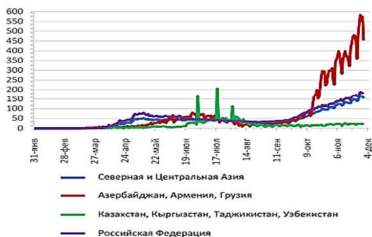
Рисунок 2 – Ежедневный прирост новых случаев инфицирования COVID-19 в Северной и Центральной Азии, отдельные страны и группы стран, январь–ноябрь 2020 г. [6]

соответственно, значительно увеличился и составил 6,1 умерших на 1000 населения (5,2 – показатель 2019 г.). Вместе с тем, население Кыргызстана с демографической точки зрения считается относительно молодым. В связи с этим, в мировой практике для проведения сопоставимости уровня смертности в странах с различной возрастной структурой населения производится расчет стандартизованного коэффициента смертности. Он представляет собой ту величину, которой мог бы соответствовать общий коэффициент смертности, если бы структура распределения населения по возрасту была приведена по составу населения Европы, принятому за стандарт. Следуя этим расчетам, коэффициент смертности населения Кыргызстана в 2020 г. составил 11 умерших на 1000 населения, что, вероятно, выше, чем в среднем по Европе» [4].