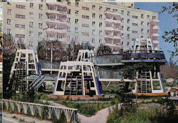
Рисунок 4 – Дворовые территории микрорайонов города Тобольска, конец 1970 – начало 1980 гг. [7, 8]