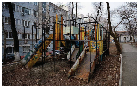
Рисунок 3 – Детские дворовые площадки и игровые комплексы 1970–1980 гг. [5]