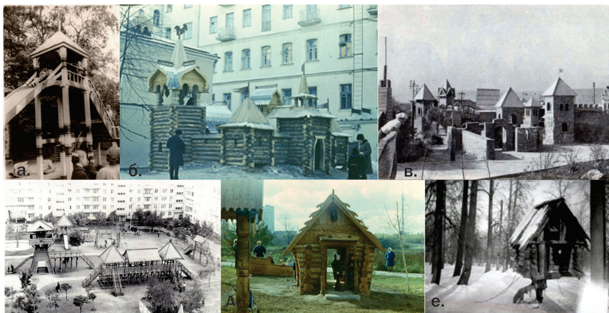
Рисунок 1 – Детский городок в Измайловском парке, 1962–1963 гг. (а, б); Детский городок «Сказка» в Протвино, 1974 г. (в); Городок в Перми на улице Мира, в районе ипподрома (г); Площадка в столичном парке Горького (д); Мурманск, детский городок у Семёновского озера (е) [2]

Наряду с этими комплексами, развивались и дворовые детские игровые площадки. В городах Советского Союза активно воздвигались жилые микрорайоны, в которых обустривались придомовые территории, сооружались детские площадки, площадь которых позволяла выделять отдельные участки для детей младшего возраста (песочницы, качели), а также и для детей постарше (турники, шведская стенка, горки). Чаще всего игровое оборудование имело общие стандартные решения, но при этом планировка дворовых территорий позволяла включать ассиметричные композиционные решения,