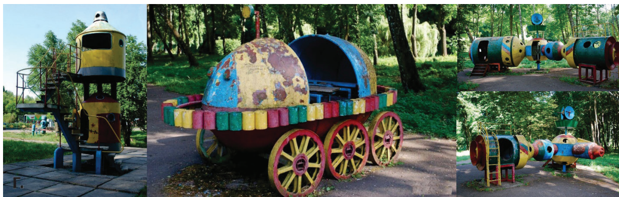
Рисунок 2 – Парк Топильче, город Тернополь [3]

с включением зон для активных игр, что создавало возможность развивать фантазию у детей и создавать свои правила игры. Несмотря на минимизированные конструкции игровых элементов площадок, они позволяли играть на этих территориях детям всех возрастов, предлагая самим подстраиваться под свои возможности [4].